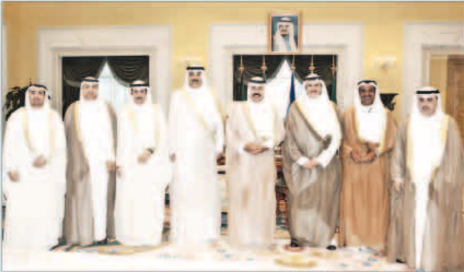
سمو ولي العهد مستقبلاً السفراء الجدد

ضاري عجران العجران، كما استقبل سموه المبعوث المشترك للامم المتحدة وجامعة الدول العربية لسوريا معالي الأخصر الإبراهيمي وذلك بمناسبة زيارته للبلاد. واستقبل صاحب السمو أمير البلاد الشيخ صباح الأحمد بقصر السيف صباح أمس رئيس جمعية الشفافية الكويتية صلاح الغزالي وأعضاء الجمعية حيث قدموا لسموه تقريراً عن منتدى الكويت للشفافية السادس «الشفافية في الأمن والدفاع».