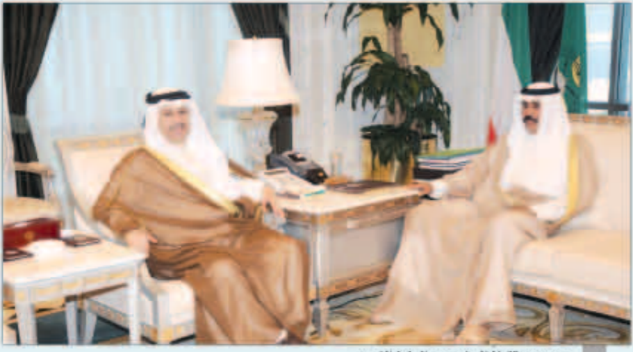
سمو مستقبلاً السفير عبد العزيز الفهد

استقبل سمو ولي العهد الشيخ نواف الاحمد في ديوانه بقصر السيف صباح أمس نائب رئيس مجلس الوزراء وزير الخارجية الشيخ صباح الخالد حيث قدم لسموه عددا من رؤساء البعثات الدبلوماسية والمقنصلي وهم كل من السفير منصور سعد العلمي قنصل عام دولة الكويت لدى جمهورية الهند «مدينة مومباي» والسفير محمد عبدالله الخالدي قنصل عام دولة الكويت لدى جمهورية باكستان الإسلامية «مدينة كراتشي» والسفير فهد مشاري الظفيري سفيراً فوق العادة ومفوضاً لدولة الكويت لدى سلطنة بروناي و«دار السلام» والسفير خالد بن يمين الفضلي سفيراً فوق العادة ومفوضاً لدولة الكويت لدى منغوليا والسفير احمد خالد الجبران سفيراً فوق العادة ومفوضاً لدولة الكويت لدى جمهورية زيمبابوي وذلك بمناسبة تعيينهم في مناصبهم الجديدة.