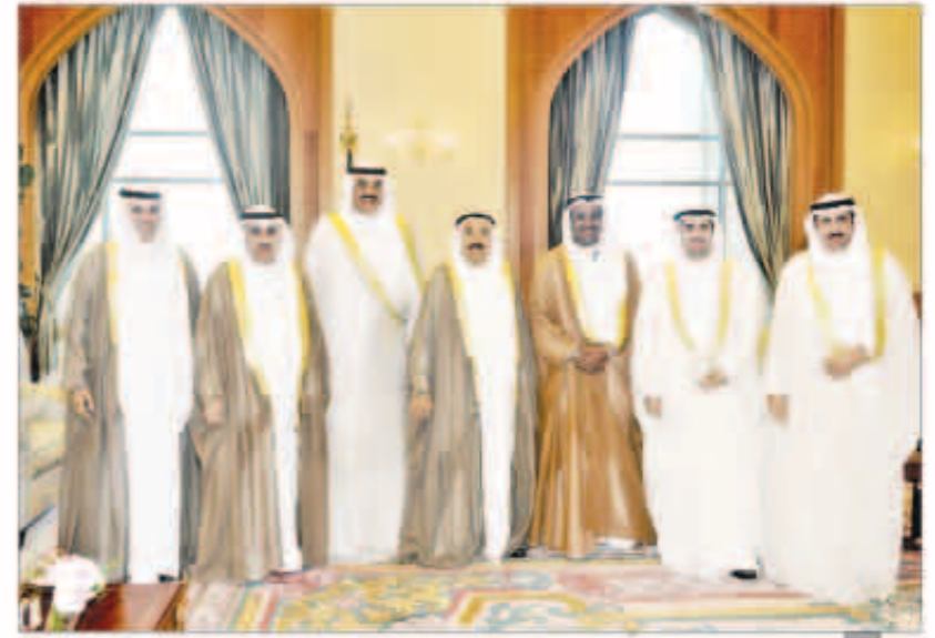
صاحب السمو مستقبلاً السفراء الجدد