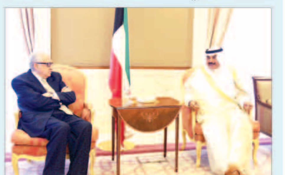
الشيخ صباح الخالد خلال لقائه مع الأخصر الإبراهيمي

اجتمع نائب رئيس مجلس الوزراء وزير الخارجية الشيخ صباح الخالد أمس مع مبعوث الامم المتحدة وجامعة الدول العربية الخاص بسوريا الأخصر الإبراهيمي. وبحث الطرفان تطورات الأوضاع في سوريا والجهود الدولية المبذولة لعقد مؤتمر «جنيف2» وسبل النجاح مؤتمر المانحين الثاني المقرر ان تستضيفه الكويت مطلع العام المقبل. وتلقى الخالد رسالة خطية من وزير خارجية جمهورية افريقيا الوسطى ليوتي بانجا بوتني