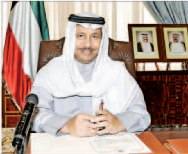
سمو الشيخ جابر المبارك

وتتويجا لذلك التاريخ الطويل من العلاقات الثنائية الأستثنائية قام سمو أمير البلاد الشيخ صباح الأحمد الجابر الصباح بزيارة رسمية إلى نيودلهي في يونيو 2006 أكد خلالها أن «العلاقات الكويتية الهندية ترقى على أرضية صلبة تنطلق من موروث تاريخي مشترك بين شعبينا وحكومتيهما تمتد جذورها لعدة عقود من الزمان.