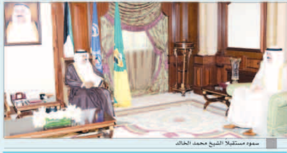
سموه مستقبلاً الشيخ محمد خالد