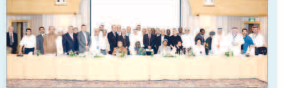
لقطة جماعية للمشاركين في اجتماعات «الصحافيين العرب»

التي استمرت ثلاثة أيام بإصدار بيان ختامي تضمن عددا من القرارات والتوصيات الداعية إلى تعزيز العمل الإعلامي العربي وتطوير مؤسساته والنهوض بكوارده. وأكد البيان على موقف المكتب الدائم للاتحاد الرافض للتدخل الأجنبي في شؤون الدول العربية بكل أشكاله وإفساح المجال أمام جميع الشعوب العربية لتقرير مصيرها بنفسها واختيار قياداتها مشددا على ضرورة تحقيق الإصلاح الشامل في المجتمعات العربية وخصوصا برامج التنمية المستدامة والديمقراطية وإيجاد بيئة سليمة للعمل الصحفي وترسيخ الحريات العامة.