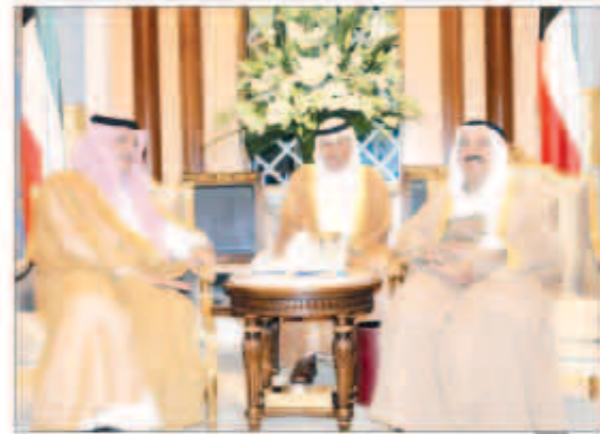
صاحب السمو تلقى رسالة شفهية من خالد الحرمين

استقبل سمو أمير البلاد الشيخ صباح الأحمد بقصر بيان صباح أمس سمو ولي العهد الشيخ نواف الأحمد. كما استقبل سموه الشيخ جابر المبارك رئيس مجلس الوزراء. واستقبل صاحب السمو صاحب السمو الملكي الأمير سعود الفيصل بن عبدالعزيز آل سعود وزير الخارجية بالملكة العربية السعودية الشقيقة ومعالي الدكتور مساعد بن محمد العيبان وزير الدولة وعضو مجلس الوزراء. حيث نقل لسموه رسالة شفوية من أخيه خادم الحرمين الشريفين الملك عبدالله بن عبدالعزيز آل سعود ملك المملكة العربية السعودية الشقيقة تتعلق بالعلاقات الأخوية المتميزة التي تربط بين البلدين والشعبين الشقيقين والقضايا ذات الاهتمام المشترك وأخر المستجدات على الساحتين الإقليمية والدولية.