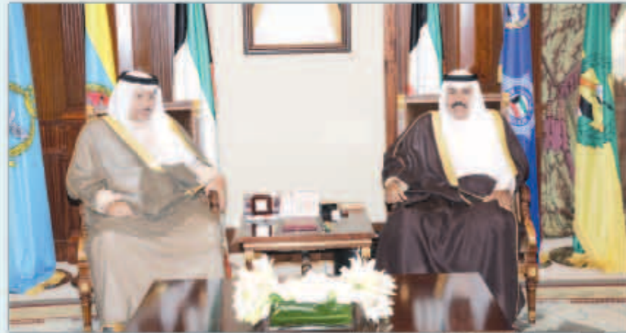
سمو ولي العهد مستقبلاً سمو رئيس الوزراء

استقبل سمو ولي العهد الشيخ نواف الأحمد الجابر بقصر بيان أمس سمو الشيخ جابر المبارك رئيس مجلس الوزراء. واستقبل سموه نائب رئيس مجلس الوزراء وزير الداخلية الشيخ محمد خالد. كما استقبل سموه نائب رئيس مجلس الوزراء وزير الدفاع الشيخ خالد الجراح. واستقبل سمو ولي العهد محافظ بنك الكويت المركزي الدكتور محمد الهاشل.