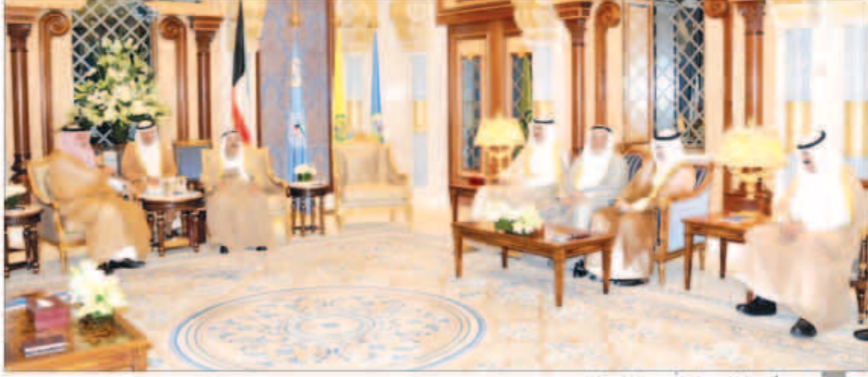
سمو أمير البلاد مستقبلاً وزير الخارجية السعودي