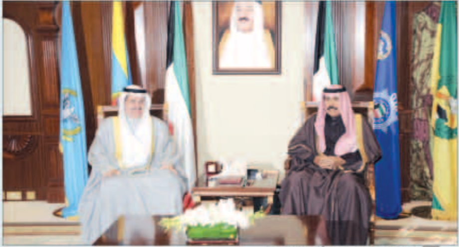
سمو ولي العهد مستقبلاً وزير المواصلات

الشيخ نواف الاحمد رئيس جهاز الأمن الوطني الشيخ ناصر العلي.