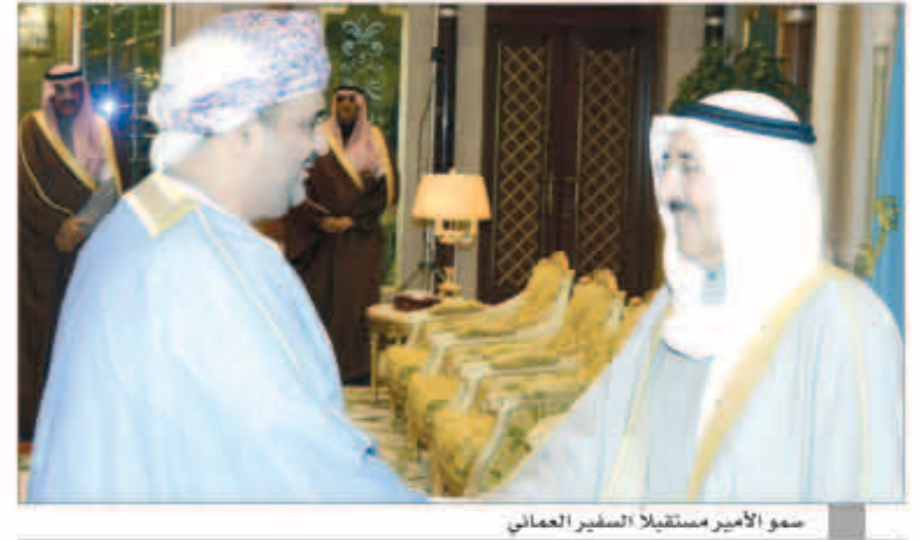
سمو الأمير مستقبلاً السفير العماني

وكيل الديوان الأميري إبراهيم الشطي ومدير مكتب صاحب السمو أحمد فهد الفهد والمستشار بالديوان الأميري محمد ابوالحسن ورئيس المراسم والتشريفات الأميرية الشيخ خالد العبدالله ومدير إدارة المراسم بوزارة الخارجية السفير ضاري العجران وأمر الحرس الأميري اللواء الركن عبدالله النواف.