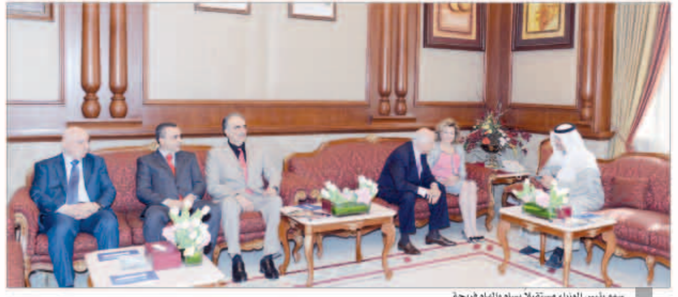
سمو رئيس الوزراء مستقبلاً بسام وإلهام فريحة

استقبل سمو الشيخ جابر المبارك رئيس مجلس الوزراء في قصر بيان صباح أمس بسام سعيد فريحة وإلهام سعيد فريحة وذلك بمناسبة زيارتهما للبلاد.