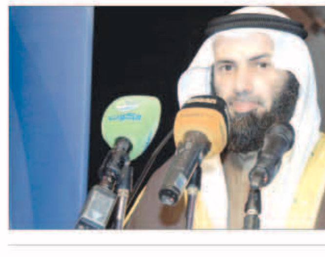
د. نايف العجمي متحدثاً

أكد وزير العدل وزير الأوقاف والشؤون الإسلامية الدكتور نايف العجمي حرص الأوقاف على استخدام أحدث نظم التخطيط الاستراتيجي وتطبيقه والاستفادة من أساليبه وطرق عمله في سعيها الحديث للقيام بدورها الريادي محلياً وعالمياً.