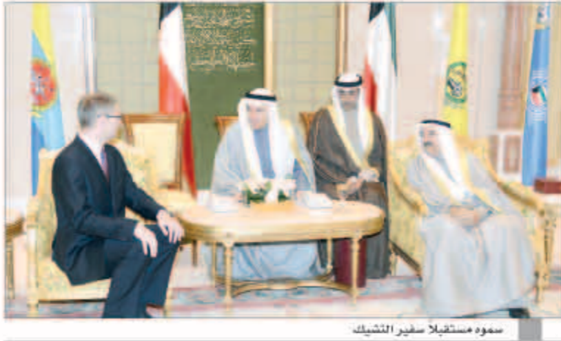
سموه مستقبلاً سفير التشيك