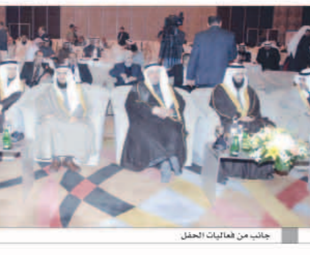
جانب من فعاليات الحفل

وتستمر فعاليات المؤتمر على مدى ثلاثة أيام بإقامة العديد من جلسات وورش العمل التي تهتم بالخطط الاستراتيجية بمشاركة فيها عدد من الاختصاصيين في هذا المجال.