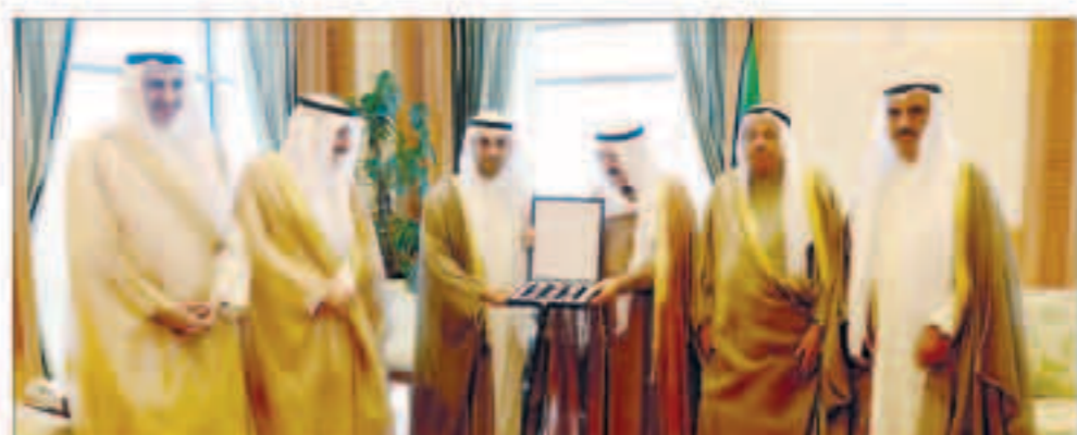
ماسب السمو يتلقى هدية تذكارية بمناسبة مرور 60 عاماً على إنشاء مكتب الاستثمار في لندن

وادسا توفيقش رئيس رئاسة اليوستس والهرسك الصديقة عبر فيها سموه رعاها الله عن خالص تهانئه بمناسبة العيد الوطني لبلادهم متمنياً لخيراته موقور الصحة ودوام العافية. واستقبل سمو ولي العهد الشيخ توفيق الاحمد وسمو الشيخ جابر المبارك رئيس مجلس الوزراء ببرقيتي تهنئة مماثلتين. ويبحث سمو أمير البلاد الشيخ صباح الاحمد ببرقية تهنئة الى فخامة الرئيس ديسيري ديلانو بوتريس رئيس جمهورية سورينام الصديقة لبلادهم فيها سموه عن خالص تهانئه بمناسبة العيد الوطني لبلادهم متمنياً لخيراته موقور الصحة ودوام العافية. ويبحث سمو ولي العهد الشيخ توفيق الاحمد وسمو الشيخ جابر المبارك رئيس مجلس الوزراء ببرقيتي تهنئة مماثلتين.