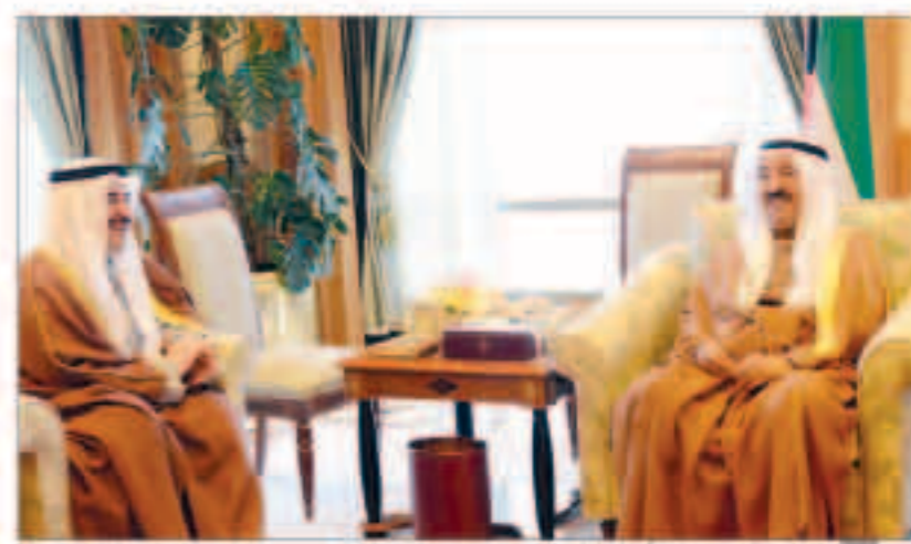
سمو الأمير مستقبلاً الشيخ أحمد الحمود

استقبل سمو ولي العهد الشيخ توفيق الاحمد في ديوانه بقصر السيف صباح أمس سمو الشيخ جابر المبارك رئيس مجلس الوزراء، واستقبل سموه النائب الاول لرئيس مجلس الوزراء وزير الداخلية الشيخ احمد الحمود. كما استقبل سمو ولي العهد نائب رئيس مجلس الوزراء وزير الدفاع الشيخ احمد خالد واستقبل سموه نائب رئيس مجلس الوزراء وزير الخارجية الشيخ صباح الخالد. واستقبل سمو ولي العهد الشيخ توفيق الاحمد وزير المالية وزير التربية وزير التعليم العالي بالوكالة الدكتور نايف فلاح الحجرف ووزير النفط وزير الأوقاف والشؤون الإسلامية بالوكالة هاني عبدالعزيز حسين يرافقهما رئيس وأعضاء مجلس الهيئة العامة للاستثمار السيد بدر السعد والسادة الأعضاء المنتدبون للهيئة عبدالله الحميضى وهلال المطيري وذلك بمناسبة مرور 60 عاماً على إنشاء مكتب الاستثمار في لندن. ويبحث سمو ولي العهد الشيخ توفيق الاحمد وسمو الشيخ جابر المبارك رئيس مجلس الوزراء ببرقيتي تهنئة مماثلتين. ويبحث سمو أمير البلاد الشيخ صباح الاحمد ببرقية تهنئة الى فخامة الرئيس ديسيري ديلانو بوتريس رئيس جمهورية سورينام الصديقة لبلادهم فيها سموه عن خالص تهانئه بمناسبة العيد الوطني لبلادهم متمنياً لخيراته موقور الصحة ودوام العافية. ويبحث سمو ولي العهد الشيخ توفيق الاحمد وسمو الشيخ جابر المبارك رئيس مجلس الوزراء ببرقيتي تهنئة مماثلتين.