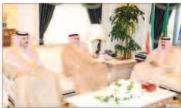
سمو ولي العهد مستقبلاً وزيرَي الدفاع والخارجية

الركيزة الأساسية لجميع الدول في تحقيق التنمية الشاملة والازدهار المنشود على المستويين الاقليمي والدولي. وقد قدموا هدية تذكارية لسموه بهذه المناسبة. حضر المقابلة وكيل ديوان سمو ولي العهد للشؤون الإعلامية الشيخ مبارك الحمود ووكيل ديوان سمو ولي العهد لشؤون المراسم والتشريفات الشيخ مبارك صباح السالم.