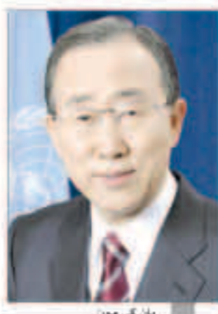
بان كي مون

وأشادت دولة الكويت قرينين لإيواء اللاجئين السوريين بتوجهات من سمو أمير البلاد في مدينة (كليس) جنوبي تركيا ضمنا 2248 بيتا جاهزا إلى جانب بناء وتجهيز مدارس ومراكز طبية ومساجد ومراكز خدمات اجتماعية مزودة بالمستلزمات الضرورية. وساهمت الهيئة الخيرية الإسلامية العالمية وجمعية النجاة الخيرية وجمعية الهلال الأحمر الكويتية ومقرعين من شعب الكويت المعطاء في تسيير فوافر مساعدات إنسانية إلى الشعب السوري في الداخل وفي مخيمات اللاجئين في دول الجوار. وأجرى فريق الشفاء الكويتي الإنساني في نوفمبر الماضي عمليات جراحية للمصابين جراء الحرب في سوريا بمستشفى الأمل في بلدة (الريحانية) في مدينة (هاطاي) جنوبي تركيا. وتستضيف اسطنبول القمة الإنسانية العالمية والتي تنظمها الأمم المتحدة للمرة الأولى بمشاركة ممثلين عن 155 دولة ومنظمة بينهم 50 رئيس دولة وحكومة وتهدف إلى بحث المشاكل والحلول وسبل التنسيق في مجال المساعدات الإنسانية.