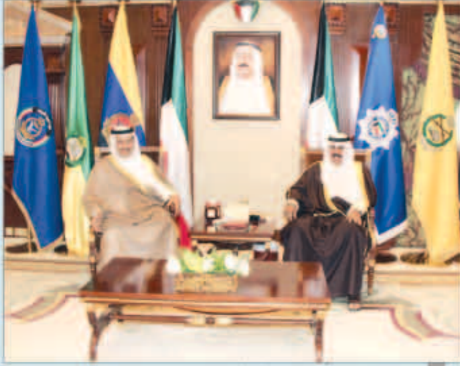
سمو ولي العهد مستقبلا سمو الشيخ جابر المبارك

استقبل سمو ولي العهد الشيخ نواف الأحمد بقصر بيان صباح أمس سمو الشيخ جابر المبارك رئيس مجلس الوزراء واستقبل سموه نائب رئيس مجلس الوزراء ووزير الدفاع الشيخ خالد الجراح.