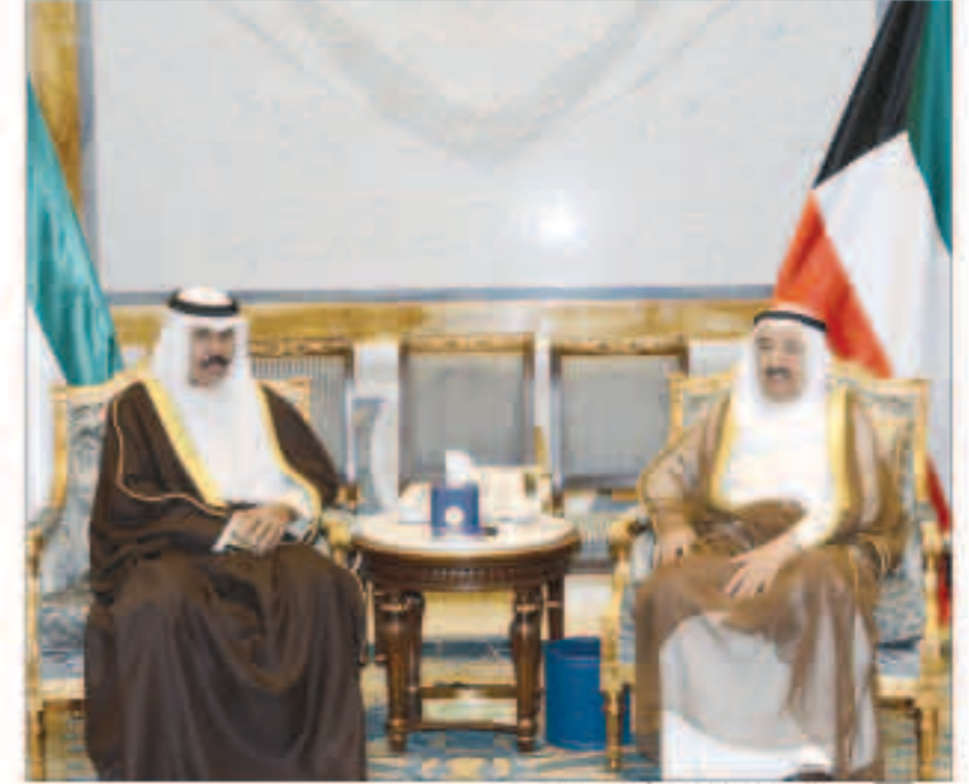
سمو أمير البلاد مستقبلا سمو ولي العهد

الاجتماعية الشيخ صباح الخالد. واستقبل سموه رئيس الحزب التقدمي الاشتراكي بالجمهورية اللبنانية الشقيقة وليد جنبلاط ورئيس مجلس إدارة مركز سرطان