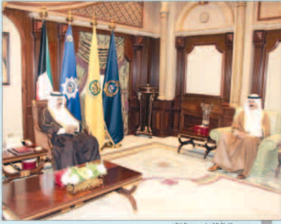
سموه مستقبلا الشيخ محمد الخالد

استقبل سمو ولي العهد الشيخ نواف الأحمد بقصر بيان صباح أمس سمو الشيخ جابر المبارك رئيس مجلس الوزراء واستقبل سموه نائب رئيس مجلس الوزراء ووزير الدفاع الشيخ خالد الجراح.