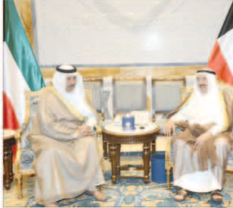
سموه مستقبلا سمو الشيخ جابر المبارك