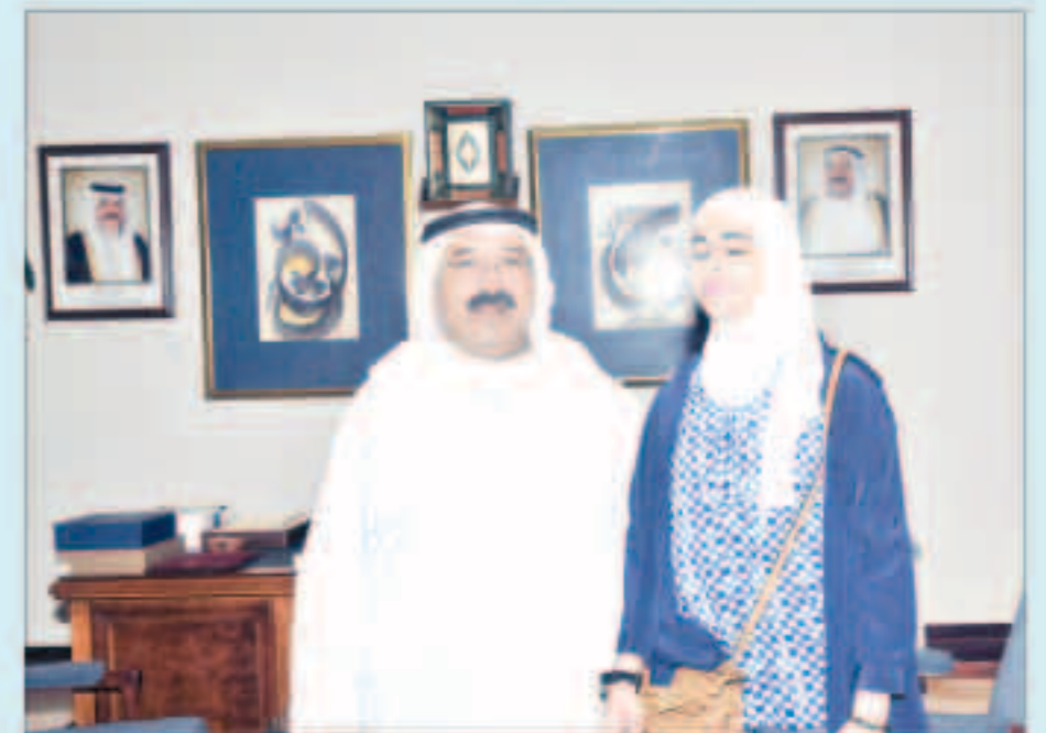
الشيخ ناصر صباح الأحمد مستقبلا الطالبة جوري العازمي

استقبل وزير شؤون الديوان الأميري الشيخ ناصر صباح الأحمد مدير عام معهد الكويت للأبحاث العلمية الدكتورة سميرة أحمد السيد عمر. والتقى الشيخ ناصر صباح الأحمد في وقت لاحق الطالبة جوري محمد سعد العازمي الحاصلة على المركز الأول في تحدي القراءة باللغة العربية. كما استقبل الطالب ناصر عيسى الجيماز الحاصل