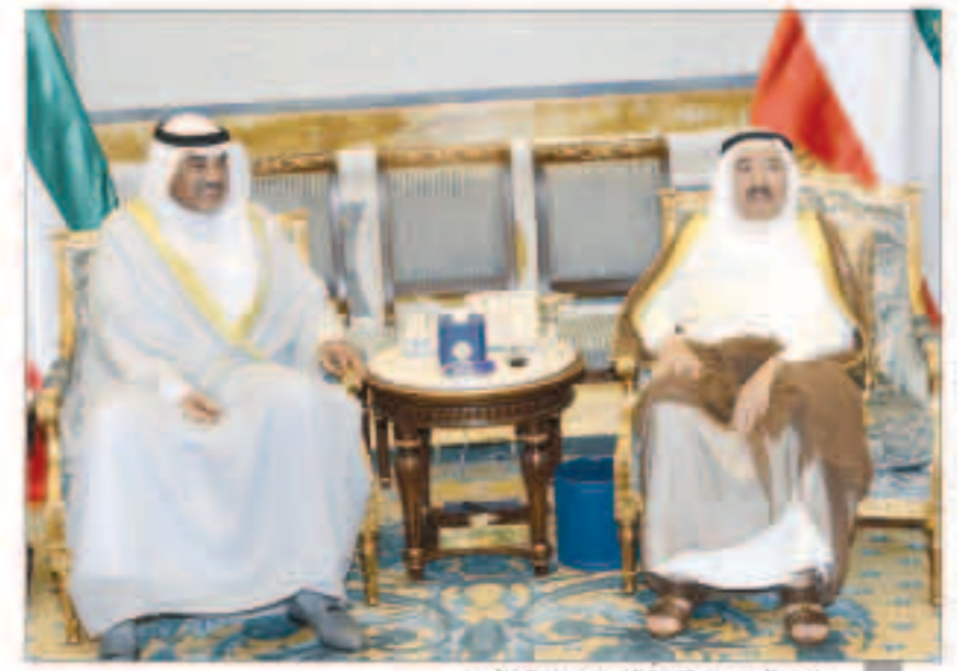
صاحب السمو مستقبلا الشيخ صباح الخالد