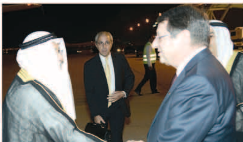
رئيس قبرص مقادرا البلاد ويح وداعه الشيخ علي الجراح