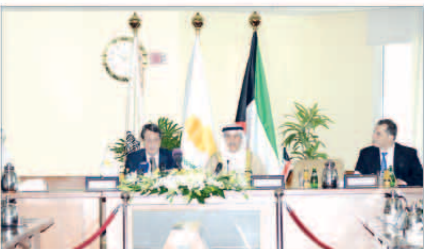
الرئيس القبرصي يلتقي كلمته خلال زيارته غرفة التجارة والصناعة

لاسيما مع التوجه لانفاق ما يقارب سبعة مليارات دولار امريكي خلال السنوات الخمس المقبلة لبناء العديد من المشروعات الضخمة والعلاقة في البلاد. من ناحية أخرى، استقبل الرئيس نيكوس اناستاسياديس المدير التنفيذي بالوكالة لقطاع الاستثمارات البديلة بالهيئة العامة للاستثمار صلاح عبدالعزیز المريخي وذلك بفر إقامة فخامته بقصر بيان. كما استقبل فخامته رئيس مجلس إدارة شركة مشاريع الكويت الاستثمارية لإدارة الأصول «كامكو»، وعضو شركة مشاريع الكويت القابضة «كيبكو» الشيخ عبدالله ناصر صباح الأحمد وأعضاء الشركة وذلك بفر إقامة فخامته بقصر بيان. حضر المقابلتين رئيس بعثة الشرف المرافقة المستشار بالديوان الأميري د. يوسف الإبراهيم. في سياق منفصل، أقام رئيس بعثة الشرف المستشار بالديوان الأميري د. يوسف الإبراهيم مأدبة غداء على شرف الرئيس القبرصي والوفد الرسمي المرافق له. هذا وغادر الرئيس القبرصي البلاد بعد زيارة رسمية استغرقت يومين.