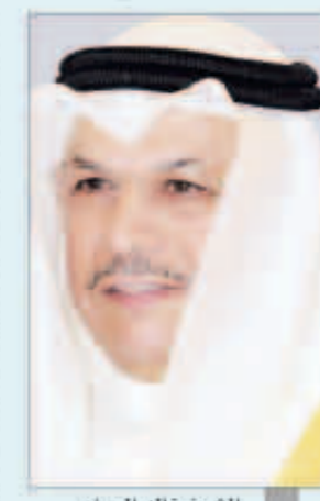
الشيخ خالد الجراح

خلال الجراح ببرقية تهنئة بمناسبة حلول عيد الأضحى المبارك، إلى سمو ولي العهد الشيخ نواف الأحمد، جاء فيها ما يلي: يسعدني أن أرفع إلى مقام سموكم الكريم أسمي آيات التهاني والتبريكات بمناسبة قدوم عيد الأضحى المبارك، ميتيلاً للباري جل شأنه أن يعيد هذه المناسبة على سموكم وأنتم ترفلون بأنواب الصحة والسعادة، وعلى وطننا العزيز بالرفي والإزدهار وعلى الامتین العربية والإسلامية بالمدج والسداد، تحت ظل قائد مسيرتنا صاحب السمو أمير البلاد.