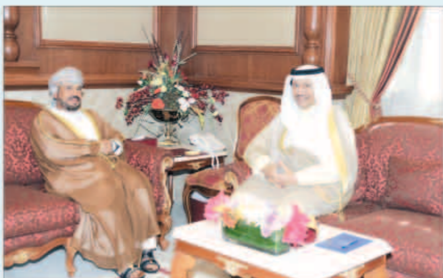
سمو الشيخ جابر المبارك مستقبلاً السفير سالم المعشني

استقبل سمو الشيخ جابر المبارك رئيس مجلس الوزراء في قصر بيان أمس، سفير سلطنة عمان الشقيقة لدى دولة الكويت الشيخ سالم بن سهيل المعشني وذلك بمناسبة انتهاء مهام عمله. وحضر المقابلة الوكيل المساعد للشؤون المحلية ديبوان سمو رئيس مجلس الوزراء الشيخ خالد محمد الخالد.