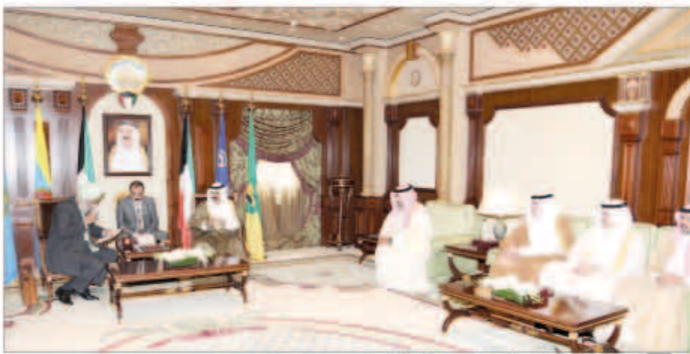
سموه مستقبلاً الشيخ تامر العلي ومستشار الأمن القومي الهندي

استقبل سمو الشيخ جابر المبارك رئيس مجلس الوزراء في قصر بيان أمس، سفير سلطنة عمان الشقيقة لدى دولة الكويت الشيخ سالم بن سهيل المعشني وذلك بمناسبة انتهاء مهام عمله. وحضر المقابلة الوكيل المساعد للشؤون المحلية ديبوان سمو رئيس مجلس الوزراء الشيخ خالد محمد الخالد.