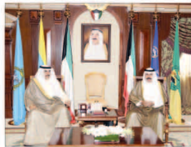
سمو ولي العهد مستقبلاً الشيخ صباح الخالد

كما استقبل سموه نائب رئيس مجلس الوزراء وزير الداخلية الشيخ محمد الخالد. واستقبل سمو نائب الأمير ولي العهد رئيس جهاز الأمن الوطني الشيخ تامر العلي يرافقه نائب مستشار الأمن القومي الهندي نيهشال ساندهو والوفد المرافق له وذلك بمناسبة زيارته للبلاد. وحضر المقابلة وكيل ديوان سمو ولي العهد للشؤون الإعلامية الشيخ مبارك الحمد ووكيل ديوان سمو ولي العهد للشؤون المراسم والتشريعات الشيخ مبارك صباح السالم الحمد.