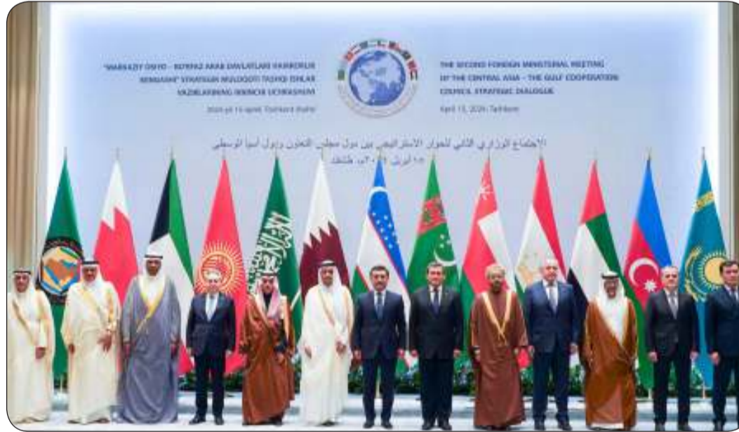
وفي لقطة جماعية مع المشاركين في الاجتماع