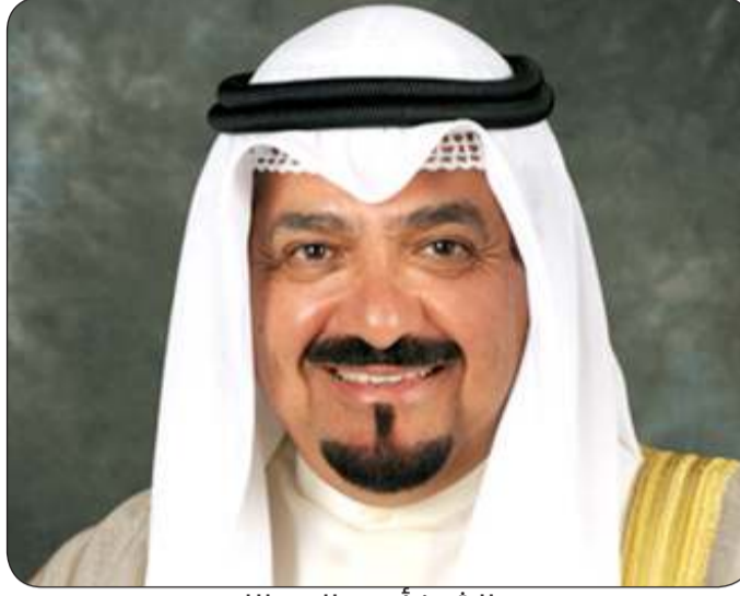
الشيخ أحمد عبدالله