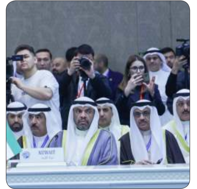
وزير الخارجية مترأساً وفد الكويت في الاجتماع

العلاقات الثنائية التي تربط البلدين والشعبين الصديقين وسبل تنميتها المجالات. وقالت "الخارجية" في بيان لها ان الاجتماع تناول اطر تاسيس شراكة مستقبلية تعزز مائة الروابط التاريخية