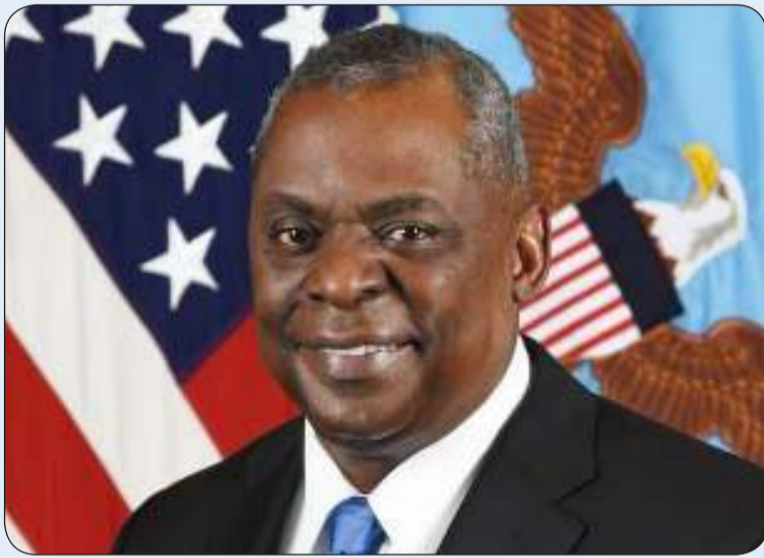
وزير الدفاع الأمريكي

بحث نائب رئيس مجلس الوزراء ووزير الدفاع ووزير الداخلية بالوكالة الشيخ فهد اليوسف مع نظيره وزير الدفاع الأمريكي لويد أوستن التطورات الإقليمية الراهنة وما تشهده من تصعيد عسكري يهدد بشكل مباشر الأمن والاستقرار في المنطقة. وذكر بيان لوزارة الدفاع ان ذلك جاء خلال اتصال هاتفي تلقاه وزير الدفاع أمس الاثنين من نظيره الأمريكي تمت خلاله مناقشة العديد من القضايا والموضوعات محل الاهتمام المشترك بين البلدين الصديقين. وأضاف البيان ان الشيخ فهد اليوسف أكد خلال الاتصال موقف دولة الكويت الرسمي الداعي إلى أهمية اضطلاع مجلس الأمن بمسؤولياته تجاه حفظ الأمن والسلم الدوليين من خلال ضمان التزام المجتمع الدولي كافة بما نصت عليه القوانين والمواثيق الدولية وضرورة تكريس النهج الدبلوماسي في تسوية النزاعات.