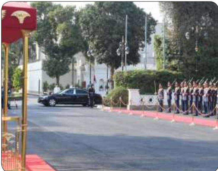
دخول موكب صاحب السمو لقرى الاتحادية