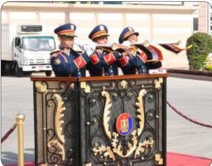
نفخ الأبواق ترحيباً بالزائر الكبير

وفي هذا الإطار قال رئيس الوزراء المصري الأسبق الدكتور عصام شرف في تصريح لـ "كونا" إن زيارة سمو الأمير إلى مصر "مهمة جداً" وتبرهن على قوة ومتانة العلاقات بين البلدين والتنسيق المستمر للتشاور حول الإزمات الإقليمية والدولية. وأضاف شرف أن حكام