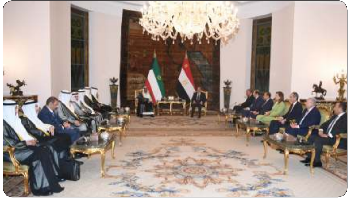
جانب من جلسة المباحثات