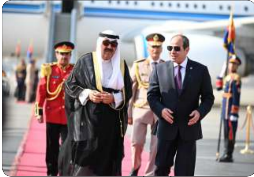
أحد أصدقاء أخوية بين الزعيمين

بين الدول العربية إزاء معالجة القضايا المشتركة وفي مقدمتها القضية الفلسطينية وتدعيم الجهود الرامية لإيقاف عدوان الاحتلال الإسرائيلي على قطاع غزة ومحاولات التوصل لإيقاف إطلاق النار. من جانبه قال رئيس مجلس الإدارة ورئيس تحرير وكالة أنباء الشرق الأوسط "أ.ش.أ" أحمد كمال إن العلاقات الكويتية - المصرية شهدت زخماً كبيراً خلال فترة حكم الرئيس عبدالفتاح السيسي في ضوء علاقات قوية وتاريخية ازدادت رسوخاً ومتانة