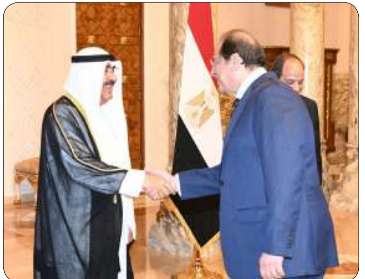
صاحب السمو مصافحاً كبار المسؤولين المصريين