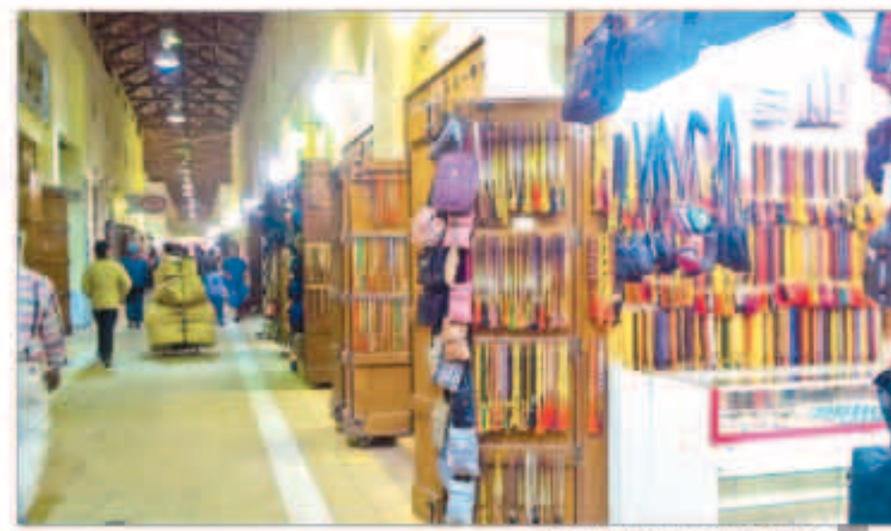
لجنة لتنظيم العمل بسوق العمل بالمباركية