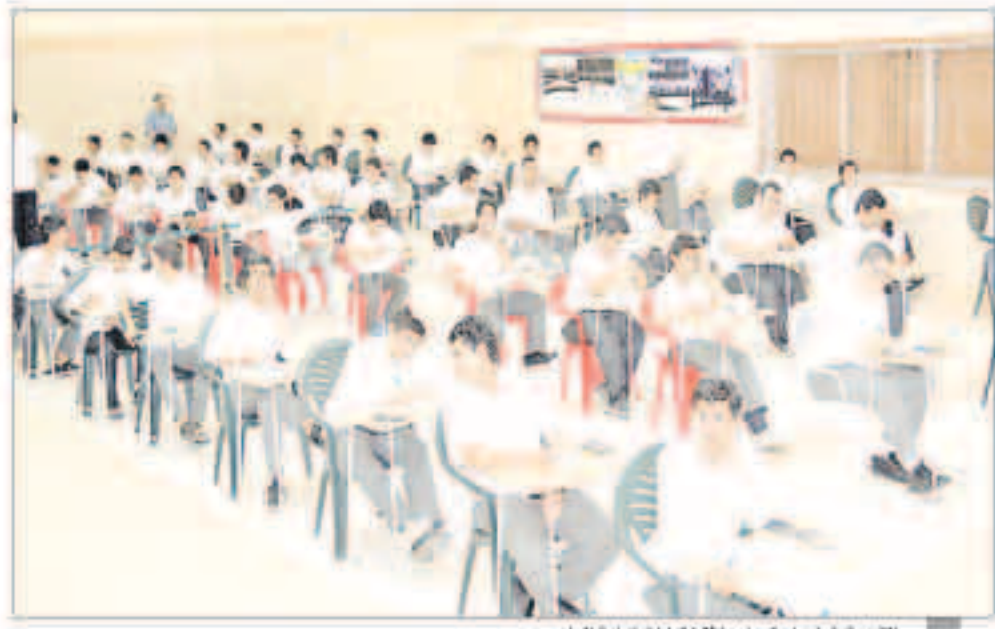
التدريب لمن استعدادها لاختبارات نهاية العام

وأكد حرص المنطقة على تجهيز كل الفصول الدراسية من حيث صيانتها أجهزة التكييف وسعة الكراسي والطاولات وتوفير المياه وما يلزم لراحة الطلبة إضافة إلى دور الشؤون الهندسية المسبق للتأكد من سلامة وصيانة المباني المدرسية. بدوره أكد مدير منطقة الفروانية التعليمية جاسم بوجهد لـ(كويتا) ضرورة توفير أجواء الاختبار المريح للطلاب وعدم التهاون مع الطلبة فيما يخص حالات الشغب والغش الإلكتروني مشددا على تطبيق لائحة الامتحانات فيما يتعلق بذلك