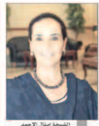
الشيخة أمثال الأحمد

تلك التفايات سواء بالمعالجة أو باي سبل ملائمة للبيئة. وشدد على أنه سيتم تطبيق هذه اللوائح على الجميع بمسطرة واحدة وأنه لن يكون هناك أي تدخل في تطبيق القانون مضمناً تعاون الجميع بهدف الحفاظ على البيئة. من جهته قال مدير إدارة الطرق السريعة في وزارة الأشغال العامة الشيخ عبدالعزيز محمد الصباح خلال اللقاء إن ماسيته 70 في المئة من الوصلات غير القانونية موجودة على مجاري المطار في سوق المباركية. وأكد الشيخ عبدالعزيز الصباح في الوزارة ستقوم بحملة تفتيشية على جميع المحال والأنشطة في السوق لرصد المخالفات وتوجيه الإنذارات