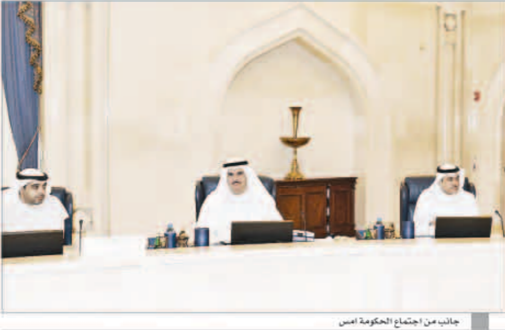
جانب من اجتماع الحكومة أمس

■ عميق القلق والألم إزاء نزيف دم الأشقاء في مصر وما طالها من دمار وتخريب