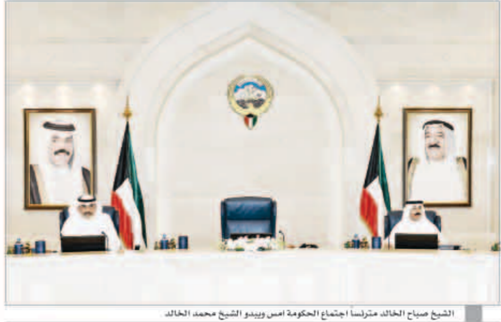
الشيخ صباح الخالد، مترأساً اجتماع الحكومة أمس ويبدو الشيخ محمد الخالد

■ اعتماد مرسوم التعريفات الإجرائية والجهات القائمة على برامج وعمليات التخصيص