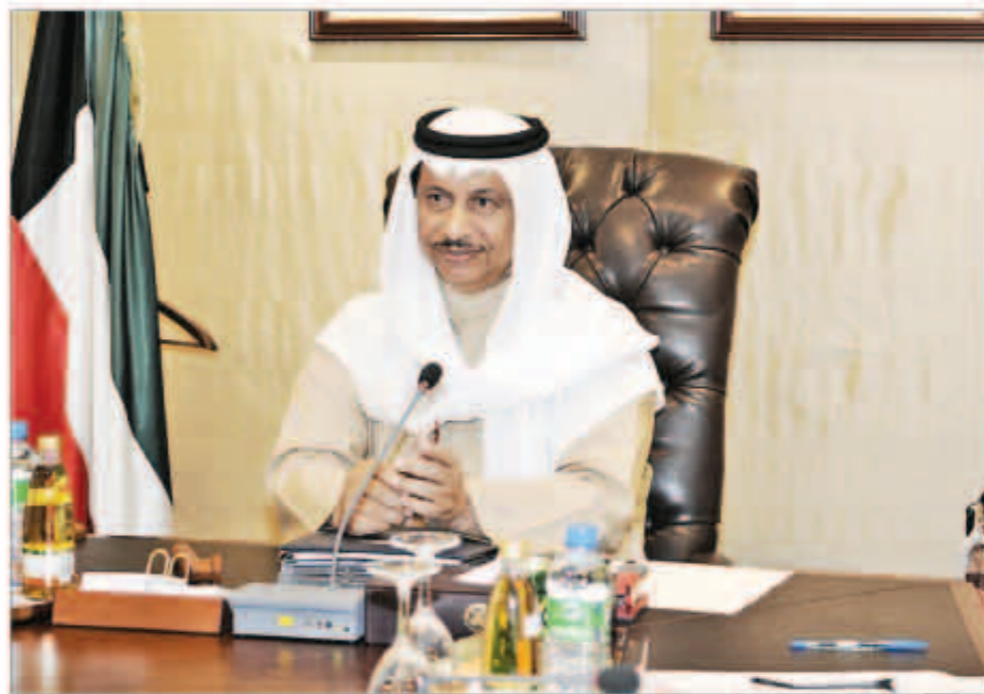
سمو رئيس مجلس الوزراء مترأساً اجتماع الحكومة أمس