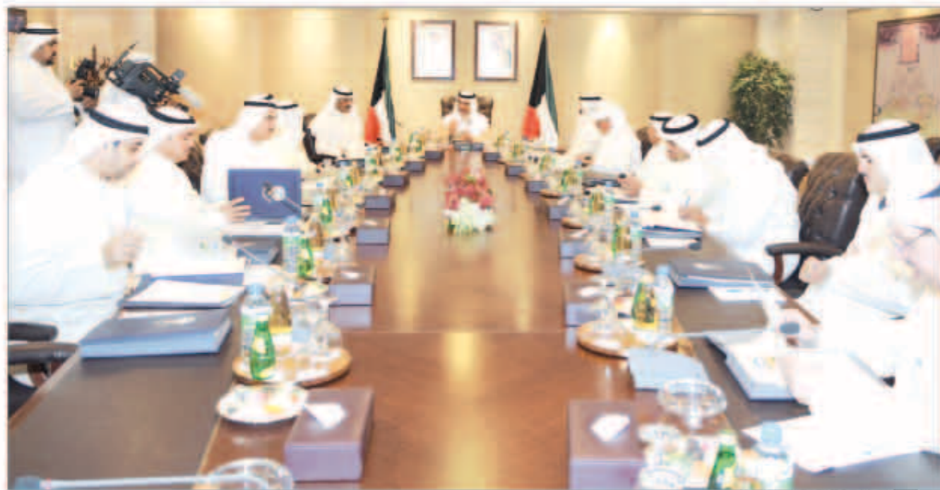
جانب من اجتماع الحكومة