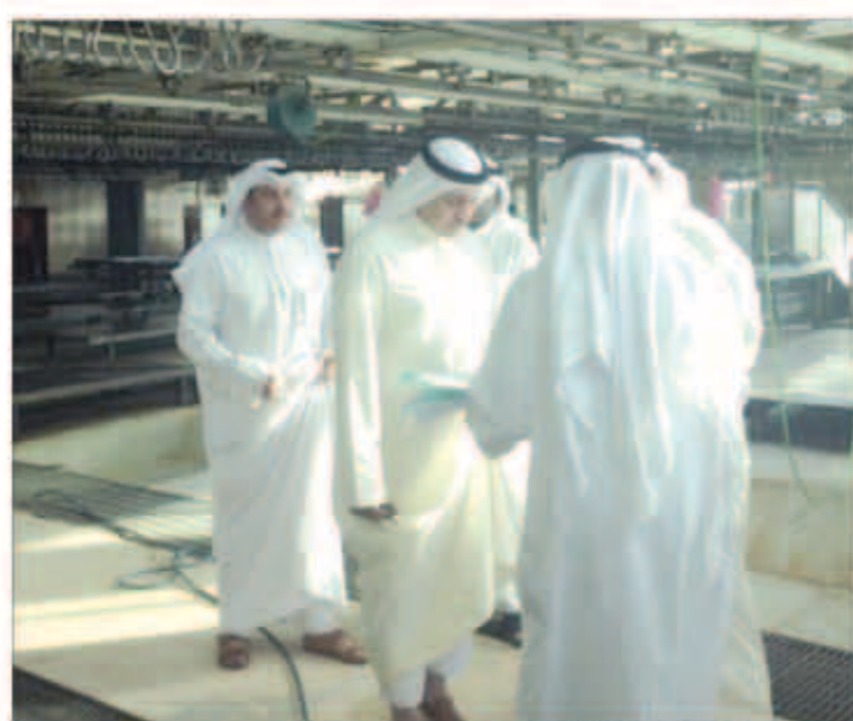
جانب من الجولة التفقدية