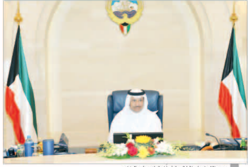
سمو الشيخ جابر المبارك مترأساً اجتماع مجلس الوزراء

■ العبدالله: صدور مرسوم بترقية 158 عضواً بإدارة الفتوى والتشريع