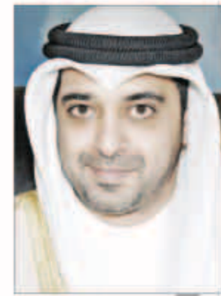
الشيخ محمد العبدالله

افتتح وزير الدولة لشؤون مجلس الوزراء وزير الصحة الشيخ محمد العبدالله مشروع إعادة تأهيل وتجديد الجناحين الأول والثاني بمبنى العلاج الإشعاعي التابع لمركز الكويت لمكافحة السرطان. وقال محمد العبدالله في تصريحه للمصاحفين خلال الافتتاح أمس، إن هذا المشروع يواكب الرؤية المستقبلية لوزارة الصحة بشأن الوقاية والتصدي للسرطان والتطوير المستمر للرعاية الطبية التخصصية.