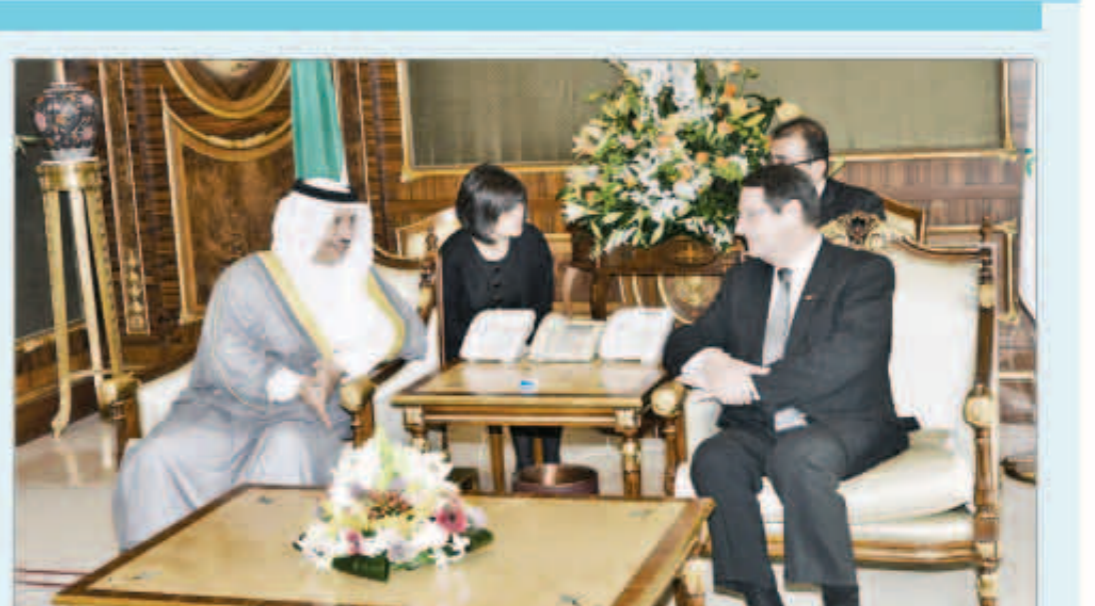
الرئيس القبرصي مستقبلاً سمو رئيس الوزراء

استقبل الرئيس نيكوس أنستاسياديس رئيس جمهورية قبرص والوفد الرسمي المرافق لفخامته وذلك بمقر إقامة فخامته بقصر بيان. كما استقبل أمس، رئيس مجلس الأمانة بالإنابة مبارك الخرينج وذلك بمقر إقامة فخامته بقصر بيان. وحضر المباحثات رئيس بعثة الشرف المرافقة المستشار بالديوان الأميري د.يوسف حمد الابراهيم.