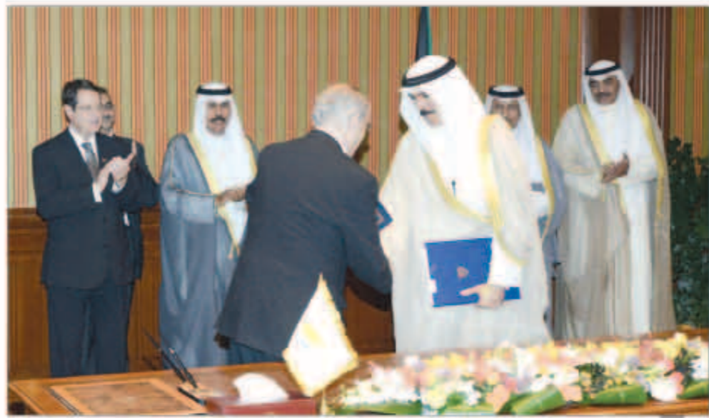
جانب من توقيع الاتفاقيات

المرافق له وذلك بمناسبة زيارته الرسمية للبلاد. هذا وقد عقدت المباحثات الرسمية بين الجانبين ترأسها الجانب الكويتي سمو نائب الأمير ولي العهد الشيخ نواف الأحمد وسمو الشيخ جابر المبارك رئيس مجلس الوزراء وكبار المسؤولين بالدولة وعن الجانب القبرصي الرئيس نيكوس أنستاسياديس رئيس جمهورية قبرص والوفد الرسمي وعدد من كبار المسؤولين بالحكومة