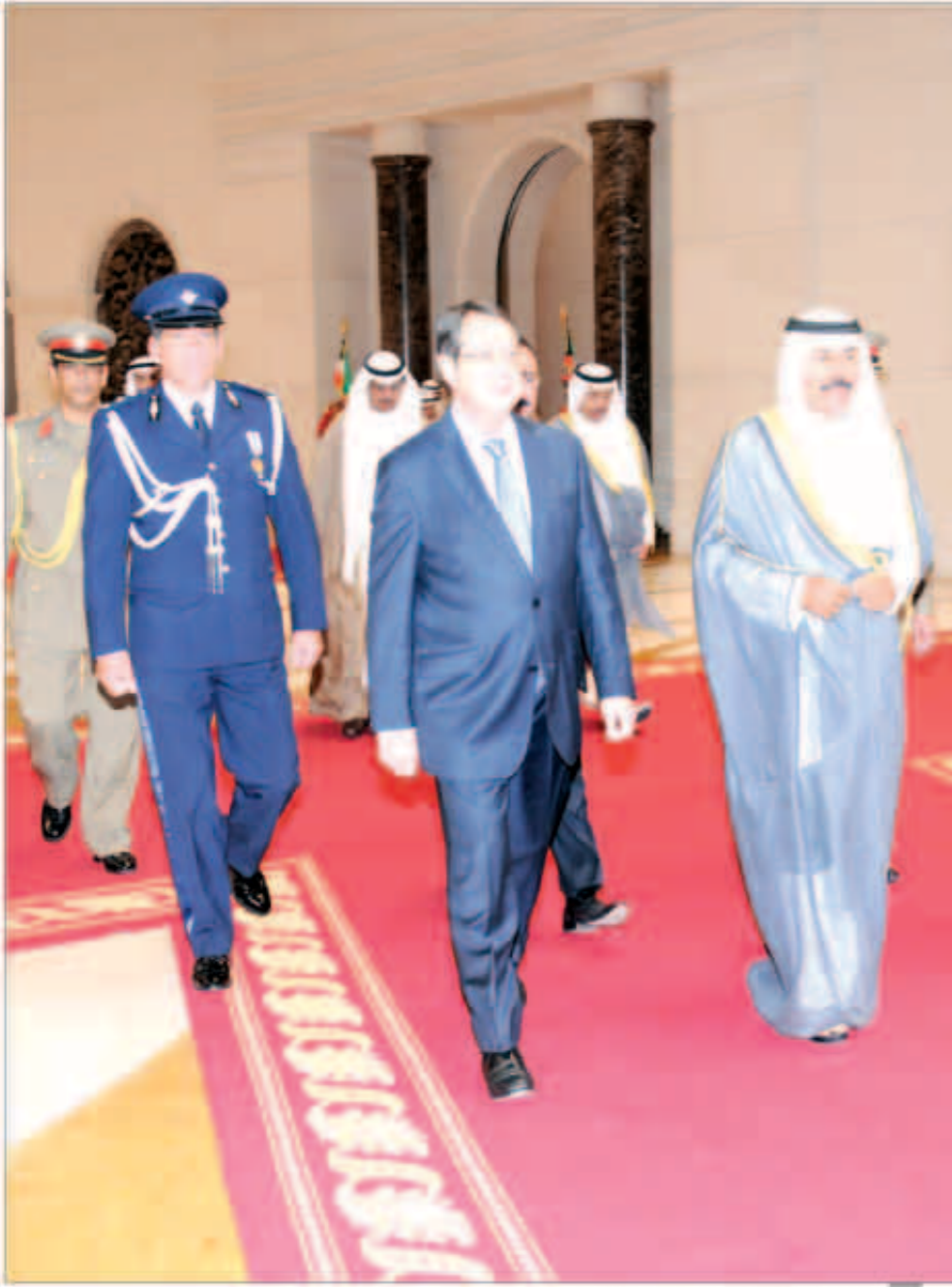
سمو نائب الأمير مساهباً لرئيس قبرص

بتوجيهات من رئيس الحرس الوطني سمو الشيخ سالم العلي، وتائب رئيس الحرس الوطني الشيخ مشعل الأحمد، أصدر وكيل الحرس الوطني بالتكليف اللواء الركن مهندس هاشم الرفاعي قرارا بالإفراج عن العسكريين الموقوفين بتهمة انضباطية وذلك بمناسبة حلول عيد الأضحى المبارك في بادرة طيبة من القيادة الكريمة بالحرس الوطني ليحتفل العسكريون بعيد الأضحى المبارك بين أهاليهم وذويهم. ويتقدم سمو الشيخ سالم العلي رئيس الحرس الوطني والشيخ مشعل الأحمد نائب رئيس الحرس الوطني باسمي آيات التهاني والتبريكات إلى صاحب السمو أمير البلاد القائد الأعلى للقوات المسلحة الشيخ صباح الأحمد وإلى سمو ولي عهده الشيخ نواف الأحمد وإلى قادة وقوات ومنتسبي الحرس الوطني كافة بمناسبة حلول عيد الأضحى المبارك سائلين المولى عز وجل أن يعيد هذه المناسبة السعيدة على الجميع بالخير واليمن والبركات وأن يديم على ربوع الوطن الغالي نعمة الأمن والأمان في ظل قيادته الحكيمة.