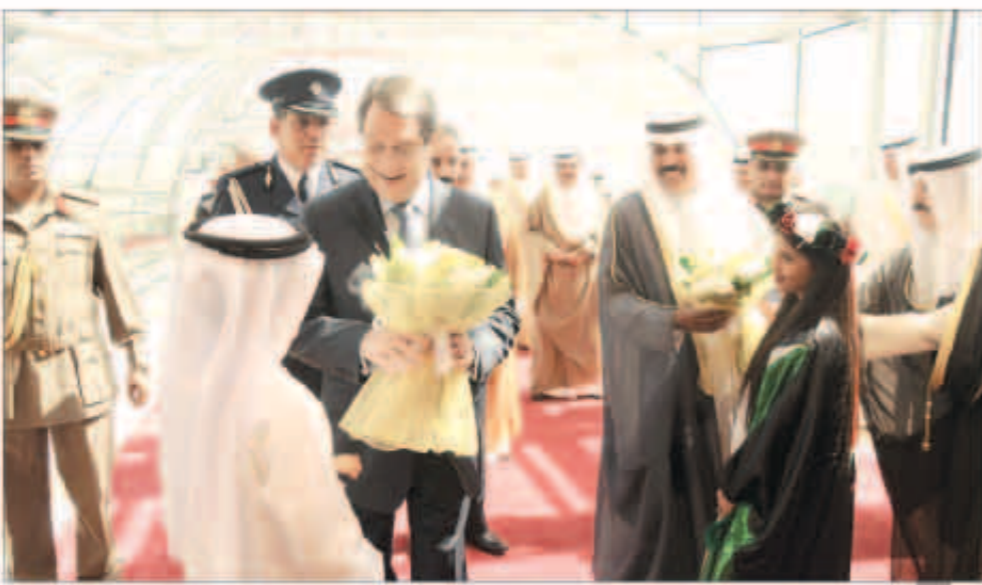
أبناء الكويت يقدمون الورد للرئيس الزائر