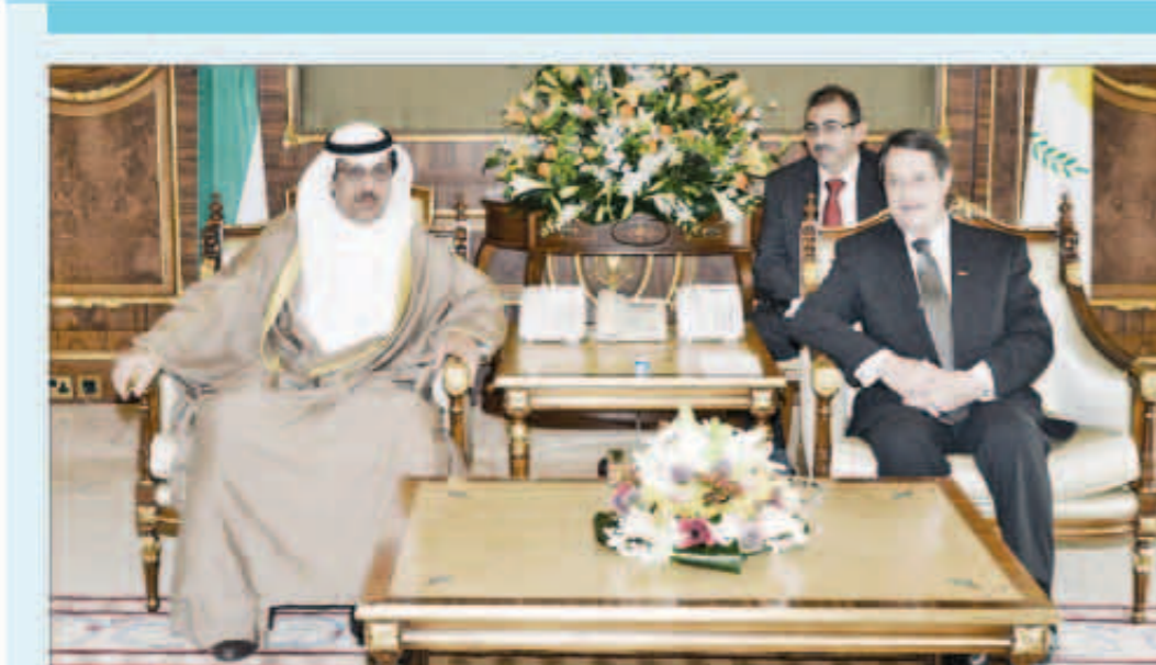
...ومستقبلاً لرئيس مجلس الأمانة بالإنابة

2- اتفاقية بين حكومة الكويت وجمهورية قبرص بشأن التعاون في مجال مكافحة الإرهاب والجريمة المنظمة والاتجار غير المشروع بالمخدرات ومواد المؤثرات العقلية وسلاتفها والهجرة غير الشرعية والجرائم الجنائية الأخرى وسبقتهما عن حكومة دولة الكويت معالي الشيخ محمد الخالد نائب رئيس مجلس الوزراء وزير الداخلية وعن حكومة قبرص د.يوسف الابراهيم كاسوليدس وزير الخارجية. 3- اتفاقية التعاون في مجال التعليم العالي والعلوم بين حكومة قبرص وحكومة الكويت وسبقتهما عن حكومة دولة الكويت مصطفي الشمالي نائب رئيس مجلس الوزراء وزير النفط