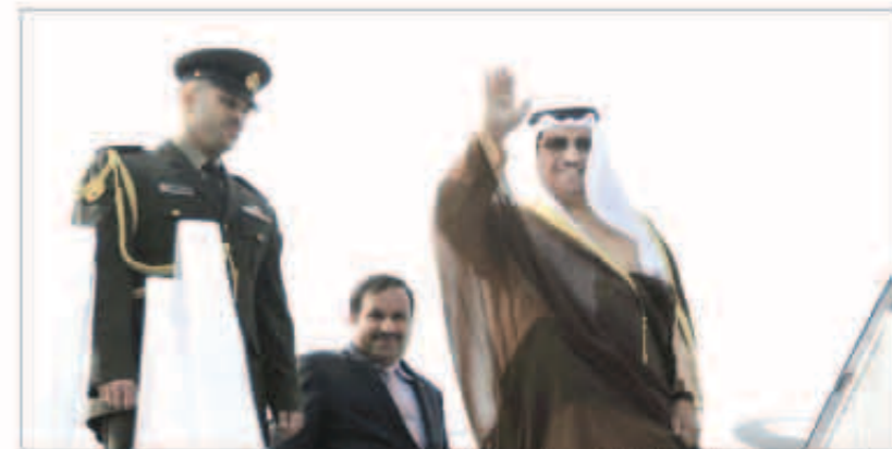
سمو الشيخ جابر المبارك لدى مغادرته الهند

الهند براتب مورجني ونقل لفخامته رسالة خطية من حضرة صاحب السمو أمير البلاد الشيخ صباح الأحمد الجابر الصباح حفظه الله ورعاه. كما جرى سموه جلسة مباحثات رسمية مع نظيره رئيس وزراء جمهورية الهند الدكتور مانموهان