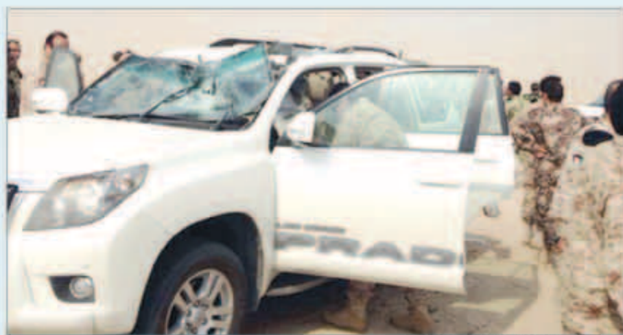
محاولة لإخراج الضباط المصابين

داخل الآلية ضابط معلم إضافة إلى 4 ضباط من منتسبي دورة القيادة والأركان المشتركة. إلى مستشفى الجبراء مبنية أن إصابة احدثهم كانت بليغة.