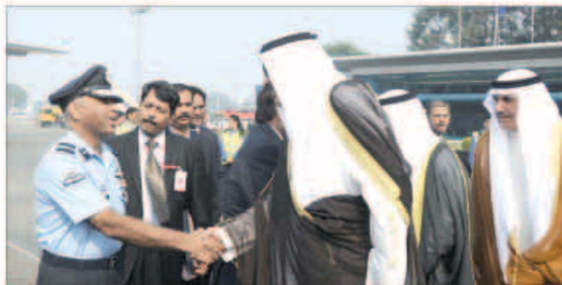
الشيخ صباح الخالد مصافحاً المسؤولين الباكستانيين