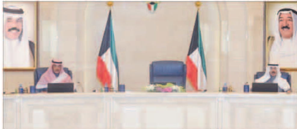
الشيخ صباح الخالد مترسلا اجتماع مجلس الوزراء