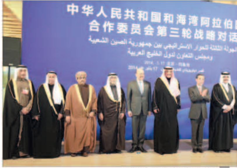
جانب من فعاليات المؤتمر التي أقيمت أمس