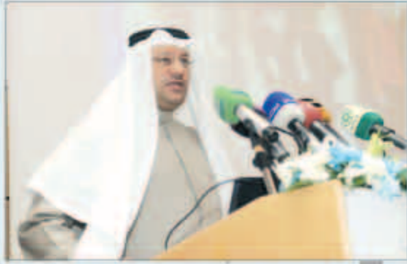
الوزير العبيدي متحدثا