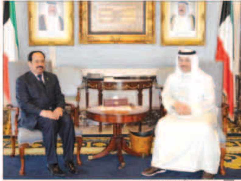
سمو مستقيل السفير السعودي

أكدت وزارة الأوقاف والشؤون الإسلامية التزامها بميثاق المسجد الذي يجعل من منابر الجمعة مشاعل نور وهداية وتوجيه للمجتمع لما فيه الخير والصلاح والهداية. وقالت الوزارة في بيان صحافي أمس أنها دائماً ما تحث خطباءها على الالتزام بهذا الميثاق موضحة أن من واجبها توضيح الأحكام الشرعية وتوجيه المجتمع لما فيه الخير والصلاح والهداية. وذكرت أنها دأبت في إعداد الخطبة التوجيهية على تحري المناسبات المهمة للحدث عنها مبيّنة أنها في كل انتخابات برلمانية تحث في خطب الجمعة على تحري الأمانة في الاختيار من بين المرشحين والتصويت لأدوي