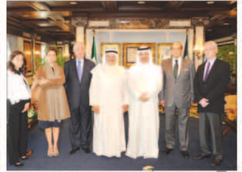
سمو رئيس الوزراء مستقبلاً أعضاء مركز سرطان الأطفال في لبنان

الشيخ فهد الجابر. واستقبل المبارك كلا على حدة سعادة سفير جمهورية كوريا الديمقراطية الشعبية هو جونغ بمناسبة انتهاء مهام عملهما. حضر المقابلة الوكيل المساعد بديوان سمو رئيس مجلس الوزراء الشيخ خالد محمد خالد الصباح.