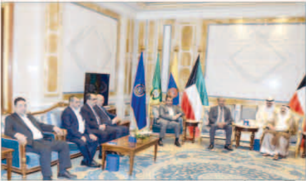
سمو مستقيل ووفد المؤتمر الشعبي والنصار الله

■ ندعم الشرعية ممثلة بالرئيس هادي ونثمن جهود الكويت الحثيثة التي تبذل من أجل تحقيق السلام