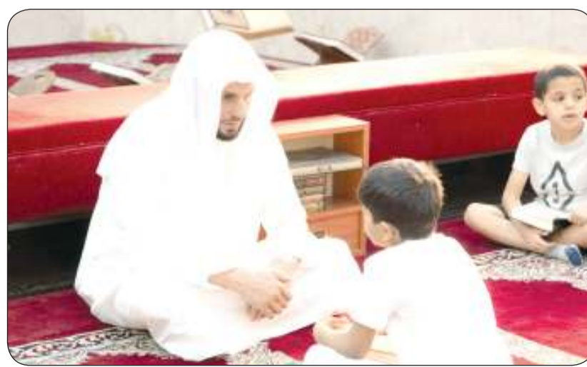
جانب من حلقات بصائر

اعلن مدير عام جمعية بصائر الخيرية عماد يوسف الشطي عن إقامة الجمعية لحلقتها السنوي لتكريم 200 من حفاظ القرآن الكريم التابعين لحلقاتها وأوضح الشطي أن الجمعية تشرف على 19 حلقة قرآنية يشارك بها أكثر من 200 طالب وطالبة من أبناء الكويت المشاركين في الحلقات. وأشاد الشطي بالإقبال الشديد على حلقات الجمعية مشيراً إلى دورها المميز في