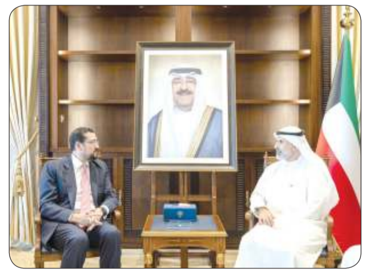
الشيخ جراح الجابر مستقبلاً سفير مملكة إسبانيا لدى الكويت

استقبل نائب وزير الخارجية السفير الشيخ جراح الجابر أمس الأربعاء سفير مملكة إسبانيا لدى دولة الكويت ميغيل خوسيه مورو اغيلار.