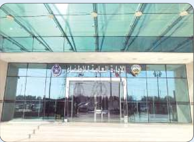
الإدارة العامة للإطفاء

الإجراءات القانونية ضد كل من قام بترويض المعلومات المغلوطة في هذا الصدد. واهاب البيان بالمواطنين والمقيمين عدم نشر الأخبار غير الصحيحة والتأكد من مصادرهما الحقيقية قبل تداولها على مواقع التواصل.