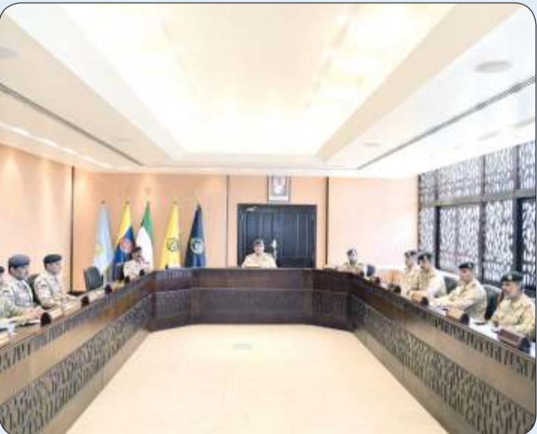
رئيس الأركان خلال ترؤسه اجتماعاً لمجلس الدفاع العسكري

وأشار الفريق المميز إلى أن تلك التوجيهات تمثل خارطة طريق ومنهاج عمل يهدف إلى دعم وتشجيع منتسبي القوات المسلحة ورفع مستوى جاهزيتهم وكفاءتهم وقدراتهم، لمواكبة التطور الحاصل في مجال التأهيل والتدريب والتسليح، ولتمكينهم من خدمة وطنهم وحمايته والذود عن ترابه الغالي.