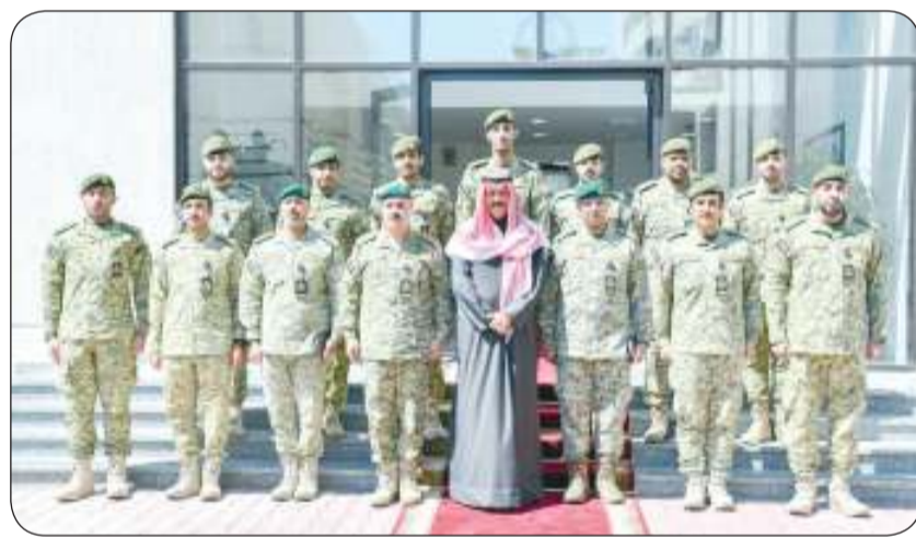
النواف خلال زيارته لمركز الحاسوب واللغات في الرئاسة العامة للحرس الوطني

واستمع نائب رئيس الحرس الوطني إلى إيجاز عن المركز والدورات التي يعقدها في مجال الحاسوب واللغات وبرنامج "قدرات 22" الذي يهدف إلى تأهيل منتسبي الحرس في اللغات الأجنبية المختلفة وابتعاث عدد منهم إلى الخارج لتعلم اللغات الأجنبية وصولاً إلى إتقانهم مهارة الترجمة الفورية فضلاً عن تعليم لغة الإشارة بالتعاون مع المركز الكويتي للسمع وعقد دورات في جهات الدولة المختلفة.