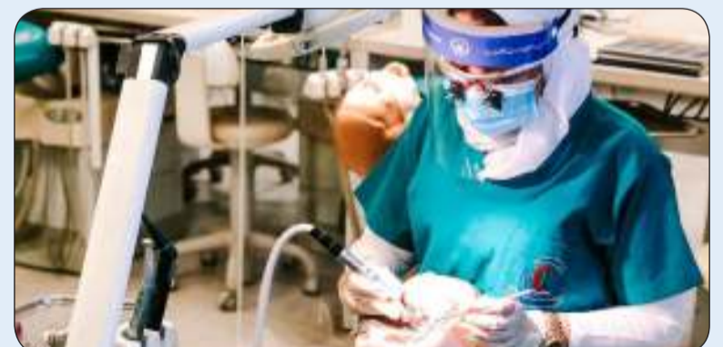
إحدى طالبات كلية طب الأسنان

أكد القائم بأعمال عميد كلية طب الأسنان بمركز العلوم الطبية في جامعة الكويت الدكتور راشد العازمي أمس الأربعاء أهمية مرحلة التدريب الإكلينيكي في الكلية وهو ما يميزها عن منح كل طالب عيادته الخاصة تحت إشراف وتقييم أعضاء الهيئة الأكاديمية ليوأكب أجواء العمل الحقيقية خلال مرحلة التدريب.