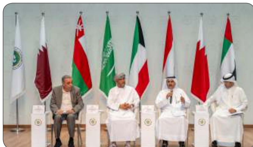
المتحدثون في الندوة

أما الدكتور الجسمي فتحدث عن «دور الإعلام في المشترك الثقافي بين دول الخليج» عبر وسائل الإعلام الحديثة من خلال منصات التواصل الاجتماعي لاسيما ان وسائل التكنولوجيا الحديثة متوافرة لدى الجميع.