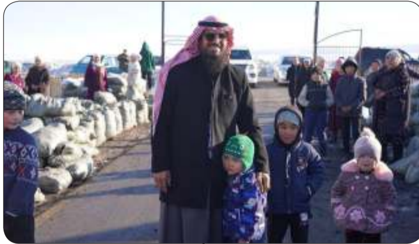
الشايح مع أحد الأطفال

وفي الختام، دعا الشايح عموم المحسنين والمحسنات إلى استمرار النذل والعطاء، مستشهدا بقول النبي صلى الله عليه وسلم «فإن ماله ما قدم، ومال وارثه ما أخر»، موضحا أن المال الحقيقي الذي ينتفع به الإنسان ما قدمه لآخرته، عبر الموقع الإلكتروني alsafakw.com أو عبر الرقم 22233322 المخصص لاستفسارات الداعمين الكرام وتبرعاتهم.