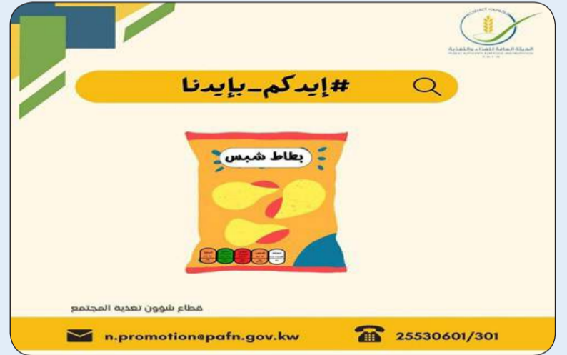
مبادرة إيدكم بايدنا

أطلقت الهيئة العامة للغذاء والتغذية مبادرة توسيم واجهة العبوات الغذائية في صورة إشارات ضوئية، ودشنتها عبر مواقع التواصل الاجتماعي ضمن هاشتاغ «إيدكم بايدنا».