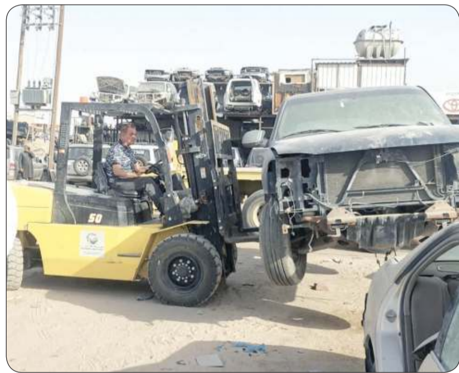
رفع السيارات المهمة

وإشغالات الطرق بولي إهتماما بالغا برفع مستوى النظافة بجميع مناطق المحافظة من خلال رفع كل ما يشوه المنظر الجمالي ويعمل على إشغال الطريق