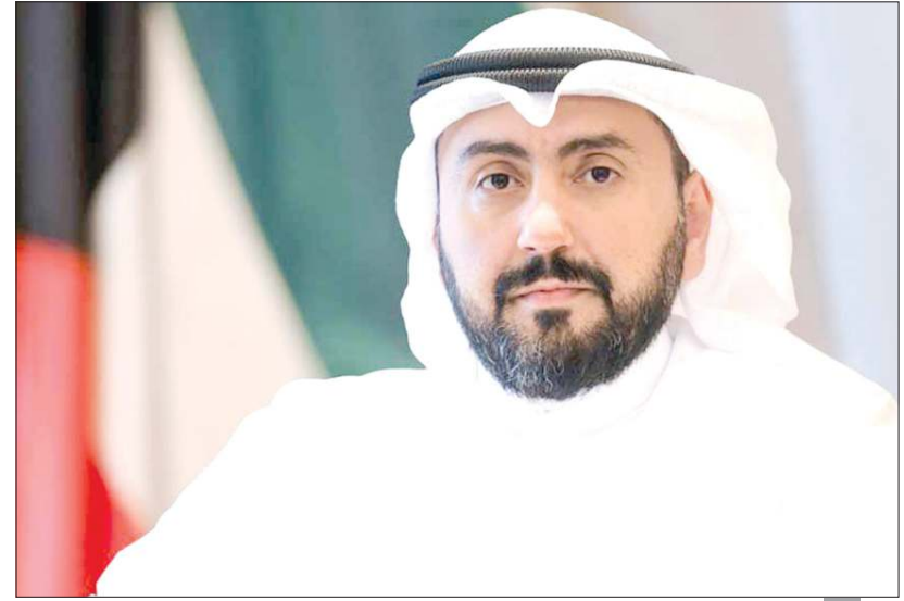
الشيخ باسل الصباح

ندعو إلى تبادل الخبرات واستخلاص الدروس المستفادة من قبل دول الإقليم أثناء التعامل مع الجائحة