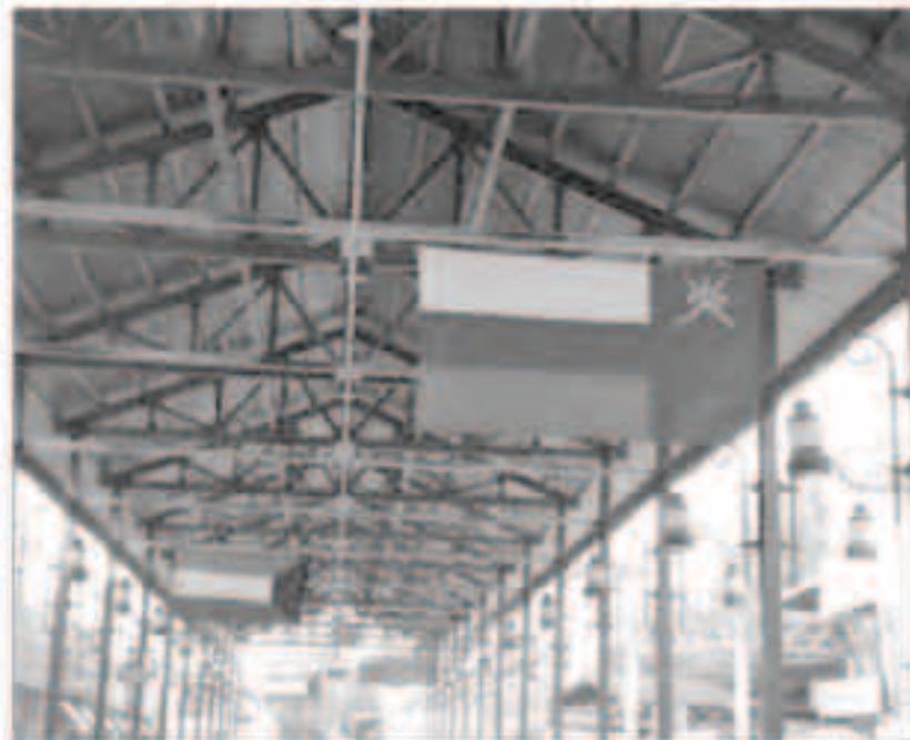
أعلام عمان زاهرت ابتهاجا بالمناسبة