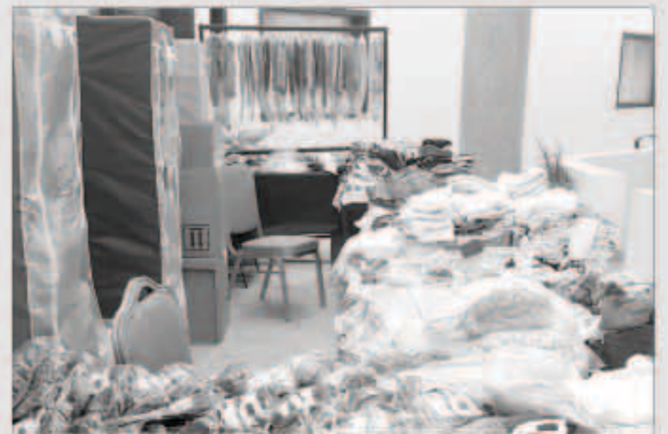
مساعداً معرض حكومة الشاه

تقل كل فريق منها بقسم خاص من احتياجات الأسر المتعففة للمساعدات وتكفل كل فريق بمباشرة وخدمة هذه الأسر حسب حاجتها.. معتدحة في الجهد الكبير في عملية التسيو من حيث الترتيب والتوصيل والتحميل والملاوطة والفرز والتعبئة وغيرها.