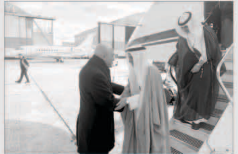
مديرنا لدى فرنسا مستقبلا الوفد القضائي

الاعلى للمجلس الأعلى للقضاء ورئيس محكمة التمييز ورئيس المحكمة الدستورية في الكويت المستشار يوسف المطوع إلى العاصمة الفرنسية باريس أمس في زيارة رسمية بناء على دعوة من الحكومة الفرنسية لبحث التعاون الثنائي. وقال سفير الكويت لدى فرنسا سامي السليمان في تصريح لـ (كونا) إن الوفد سيلتقي خلال الزيارة كبار المسؤولين الفرنسيين في المدرسة الوطنية للقضاء والمجلس الأعلى للدراسات والمحكمة العليا للقضاء