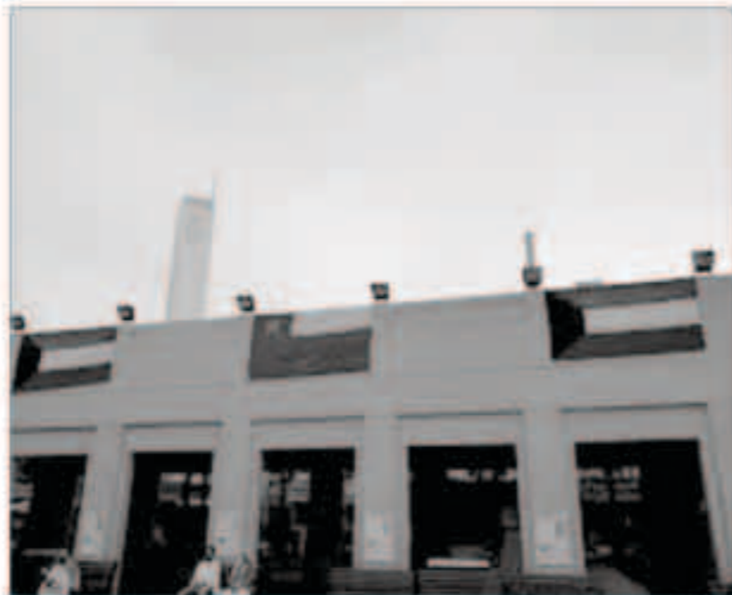
العلم الكويتي بجوار العماني احتفالاً باليوم الوطني العماني

سلطنة عمان على رواد السوق، فضلا عن بث مبارك بتلفزيون الكويت.