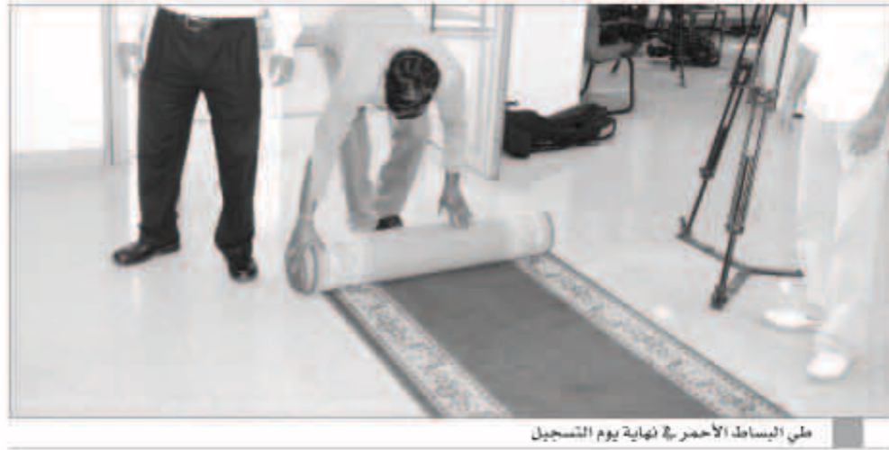
علي السباط الأحمر في نهاية يوم التسجيل