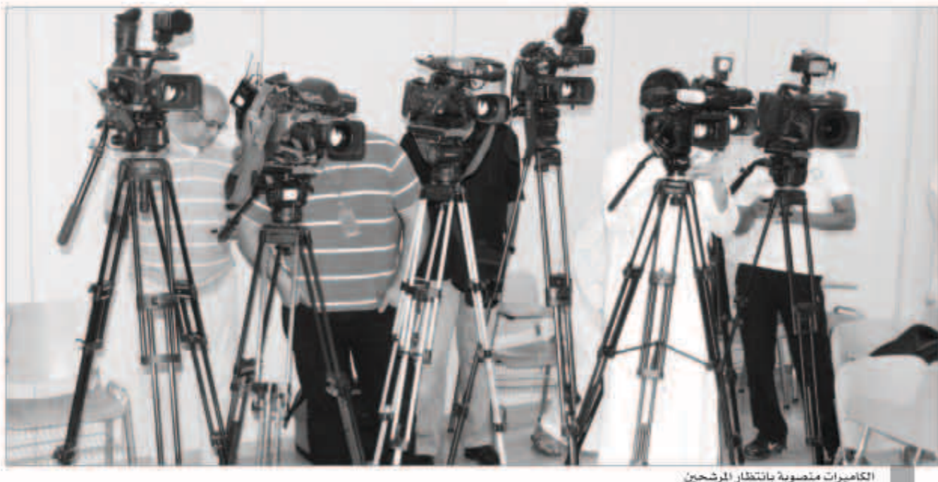
الكاميرات منصوبة بانتظار المرشحين