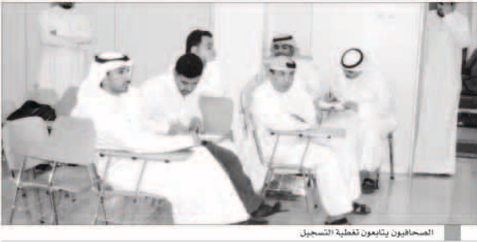
الصحافيون يتابعون عملية التسجيل

■ نتمنى وجود قفزات مستقبلية من قبل المجلس البلدي لتحقيق طموحات الشعب وآماله