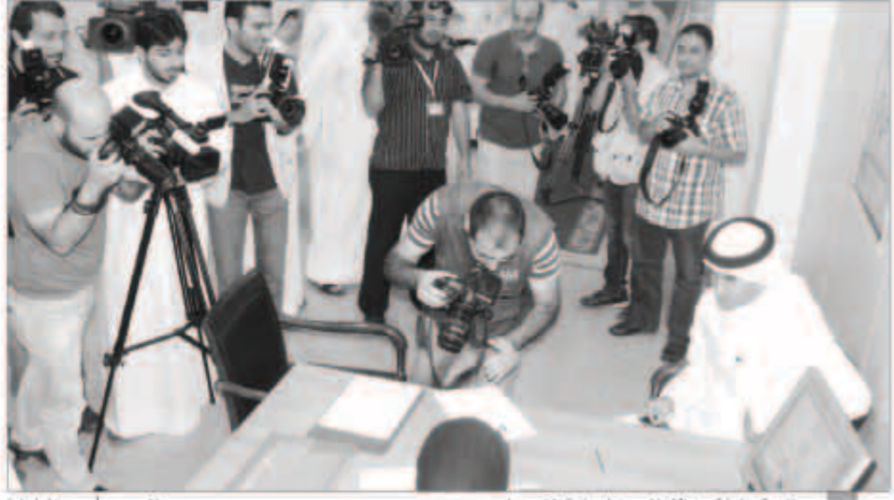
متابعة حثيئة من الإعلاميين لعملية التسجيل