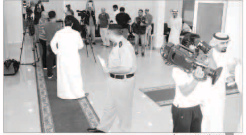
إدارة الانتخابات كما بت أمن

في هدوء ملحوظ أرجع البعض سببه ليوم العطلة الرسمية