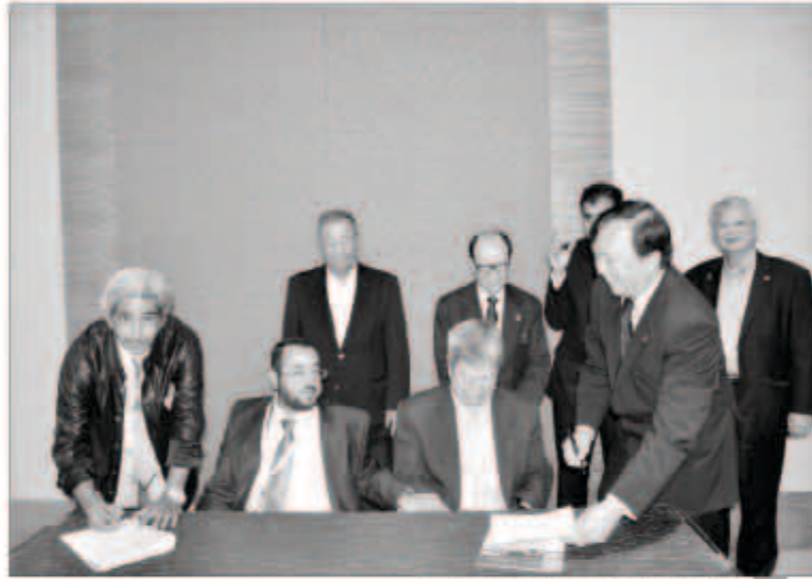
الحزبي وجون كى يصادقان على الاتفاقية