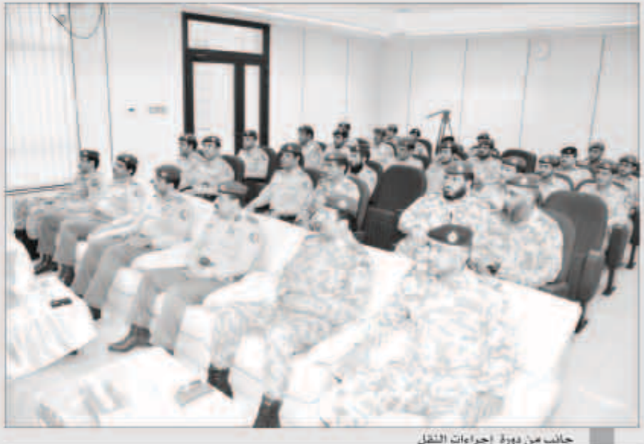
جانب من دورة إجراءات النقل

شهد وكيل الحرس الوطني بالتكليف اللواء الركن مهندس عاشم عبدالرزاق الرفاعي، افتتاح دورة «إجراءات النقل لضباط الصف والأفراد» التي عقدتها مديرية التنظيم والتخطيط الاستراتيجي. وقال مدير مديرية التنظيم والتخطيط الاستراتيجي بالتكليف المقدم أنور خالد الخريزج ان عقد هذه الدورة يهدف إلى التأكيد على نشر مفهوم عملية النقل والأهداف المرادة منها، بين كافة منتسبي الحرس الوطني وذلك انطلاقاً من مبدأ الشفافية وتعزيزاً للعدالة وتكافؤ الفرص مما يساهم في تحقيق الرضا الوظيفي لكافة