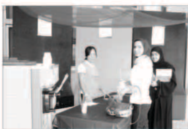
فرحة على وجوه طالبات البنات الجامعية،