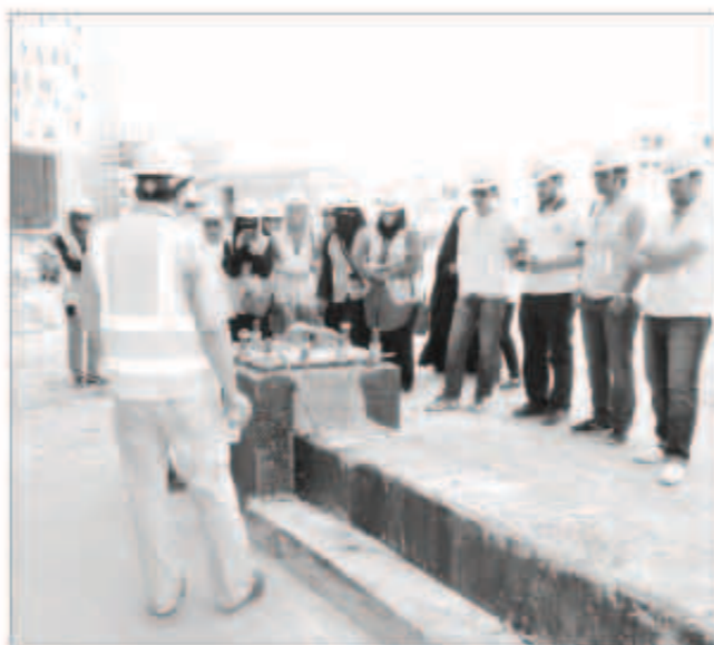
شرح عملي للمهندسين خلال الدورة