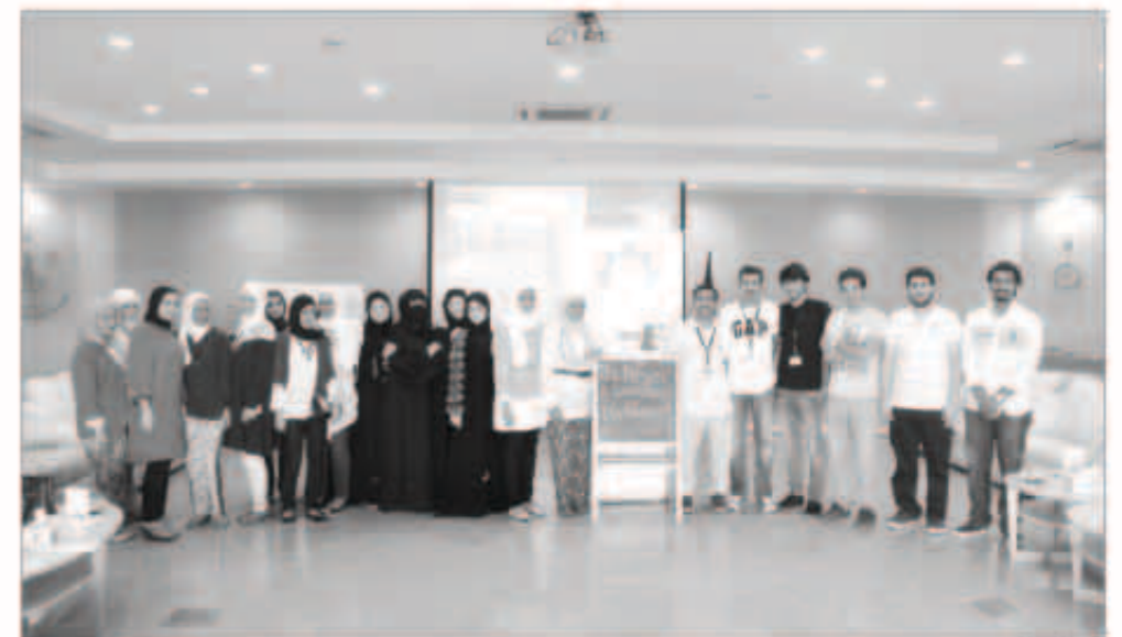
المهندسون المدنيون خلال الجانب النظري من الدورة