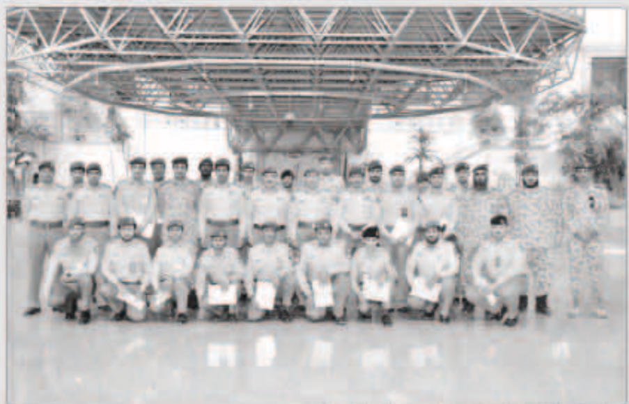
اللواء الرفاعي يتوسط الحضور في لقطة جماعية

العسكريين. وأضاف ان عمليات النقل تخضع لاعتبارات عدة منها توجيهات القيادة العليا للحرس الوطني والتنظيم الاستراتيجي الأمثل ونسب استكمال الوحدات وحاجة الوحدات من التخصصات والخبرات. حضر الافتتاح قائد الشؤون المالية والتجهيز اللواء ساجد مجبل معيوف وقائد الإسناد العميد الركن فالح شجاع فالح وقائد التنظيم والقوى البشرية بالحرس الوطني العميد الركن فهد عبد ناصر وأمر مدارس الحرس الوطني العميد الركن نادر شيهان حجبل وعدد من الضباط.