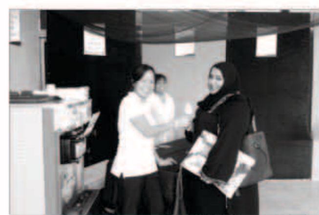
استقبال حافل للطلبات