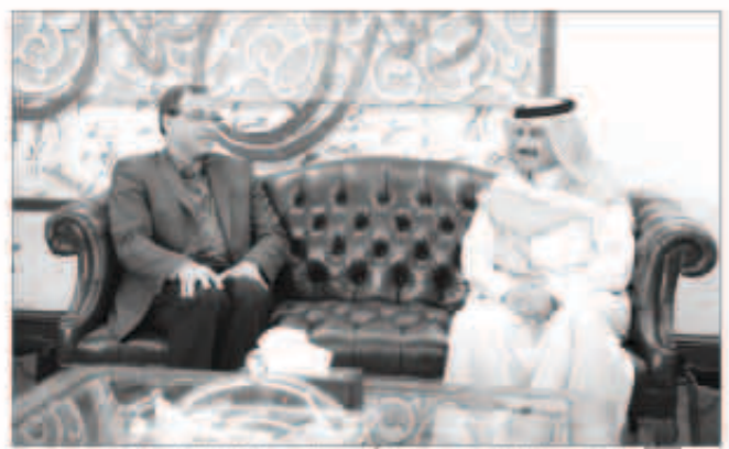
الشيخ مبارك الدعيج مستقبلاً رئيس تحرير الإذاعة البريطانية

الإنباء الكويتية «كونا» والدور الإعلامي الكبير الذي تقوم به في العالم العربي مشيراً إلى الخدمات الإعلامية التي استحدثتها «كونا» والتي تعد رافداً مهماً لنشر الثقافة والوعي في الوطن العربي. وأكد سليمان رغبة هيئة «كونا» في تطوير التعاون القائم مع «كونا» وتعزيزه بما يسهم في دعم الخدمات الإعلامية التي تقوم بها الوكالة.