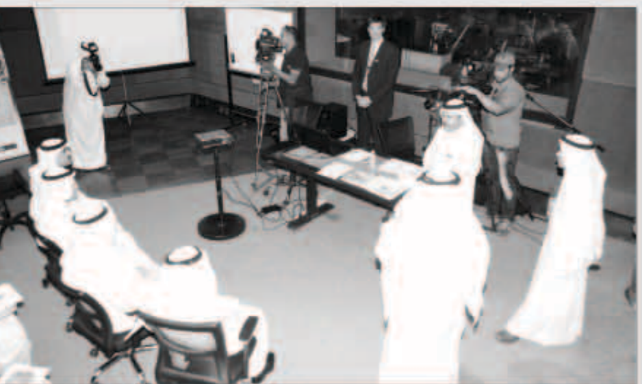
جانب من المحاضرات خلال الدورة