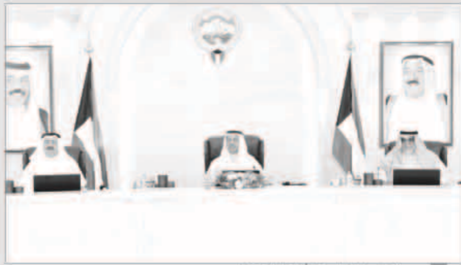
سمو الشيخ جابر المبارك مترأساً اجتماع الحكومة أمس