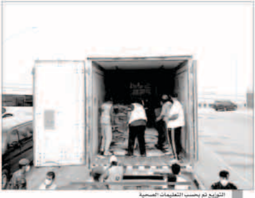
التوزيع تم بحسب التعليمات الصحية

مجتمعه فالأوقات محاسب عليها الناس فقد قال رسول الله صلى الله عليه وسلم لا تزول يوم القيامة قدماً عبد حتى يسأل عن أربع عن عمره فيما أفناه وعن جسده فيما أبلاه وعن علمه ماذا عمل فيه وعن ماله من أين أخذ وكيف أنفق.