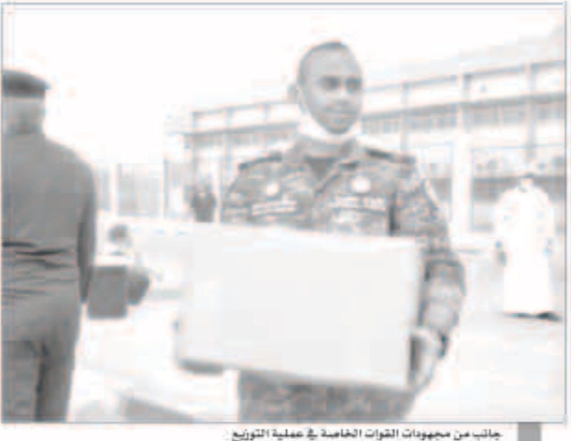
جانب من مجهودات القوات الخاصة في عملية التوزيع

حولي والسائلة وفي محافظة الاحمدى كما تم توزيع 138 سلة على الاسر المحتاجة في العرة والسائلة بالإضافة للتوزيع 50 سلة اخرى لعدد من الاسر يوصيها الى منازلهم في اماكن متفرقة.