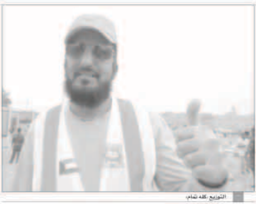
التوزيع كله تمام

المساعدات العينية في منطقة جليب الشيوخ والتي تخضع لحجز كفي وفي وقفة كويبية مشرفة لرجال القوات الخاصة والمتواجدين هناك حيث شاركوا مع فريق المتطوعي