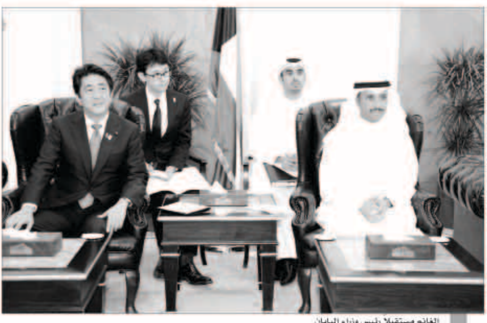
الغانم يستقبل رئيس وزراء اليابان