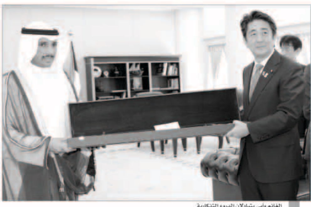
الغانم وآبي يتبادلان الدروع التذكارية

استقبل رئيس مجلس الأمة مرزوق علي الغانم في مكتبه بمجلس الأمة صباح أمس رئيس وزراء اليابان شينزو آبي والوفد المرافق له في إطار زيارته للبلاد. وبحث الغانم وآبي خلال اللقاء القضايا الإقليمية وأوضاع الشرق الأوسط حيث أشاد الغانم بالدور الياباني الداعم للسلام في المنطقة مشيدا