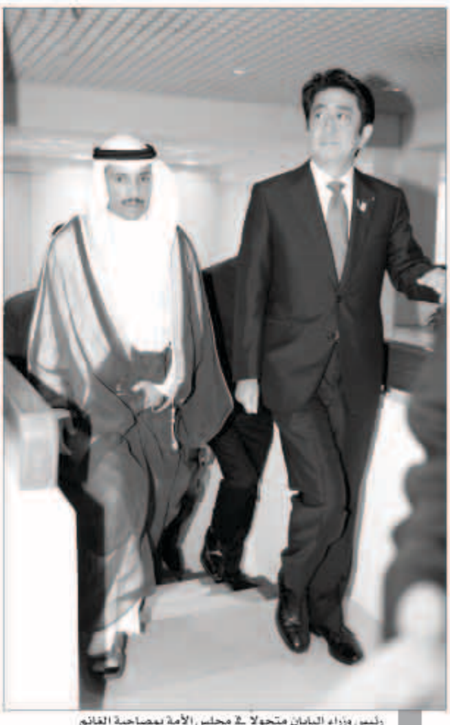
رئيس وزراء اليابان متجولا في مجلس الأمة بمصاحبة السفير