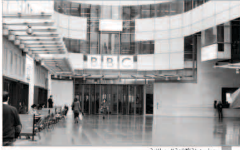
مبنى هيئة الإذاعة البريطانية

في السكن الخاص سيجعل مثل الاستثماري قول حق يراد به باطل خاصة واننا نعلم جميعا ان هناك العديد من الأسر الكويتية تسكن الاستثماري الان وتتكبد الإيجارات المرتفعة لوجود الأزمة السكنية والأولى ان ترتفع بعدد ادوار قوائمهم بدلا من ان يسكنوا السكن الاستثماري وقال ان القوائم فوق 400 متر لا تستطيع بناء غير دورين ونصف الدور نتيجة للقانون فهل هذا عدل ان يفرق القوائم من 400 متر قسمة مساحتها 400 متر واخرى 405 إمتارا؟ وإننا لذلك ومن باب العدالة بين المواطنين وللتنوع على الاسر تطالب بزيادة نسبة البناء في السكن الخاص مع مساواة نسبة البناء في القوائم من 400 الى 500 متر مع القوائم الأقل من 400 متر.