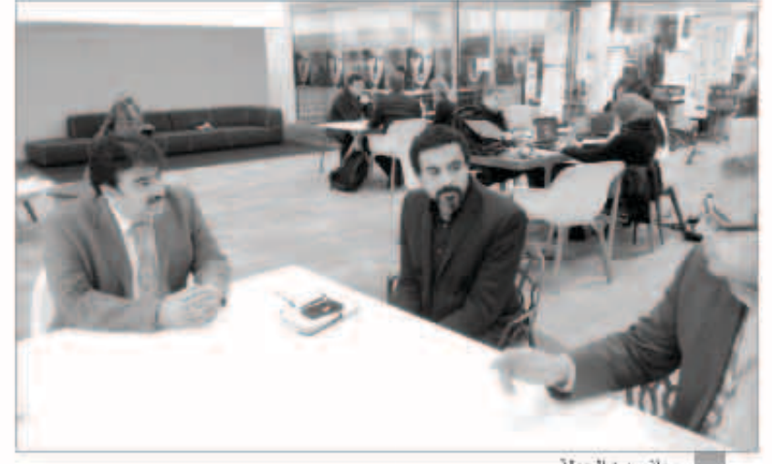
جانب من الجولة