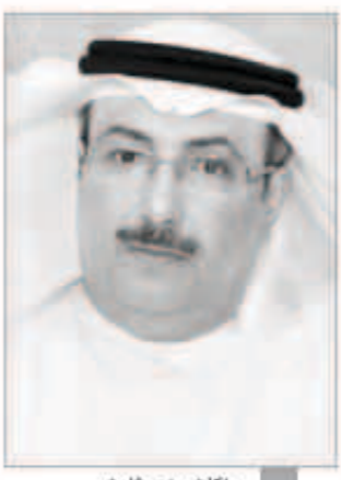
راكان بن حثلين

الحمد، وبعض أبناء الأسرة الحاكمة، ولكن السحر الآن انقلب على الساحر. وشدد على أن سمو الشيخ ناصر المحمد هو أحد أبناء الأسرة الحاكمة شاء من شاء وأبى عن أبي، وشخصية لها مكانتها السياسية والاجتماعية. وأضاف: إن أي تدخل في شؤون الحكم مرفوض تماماً