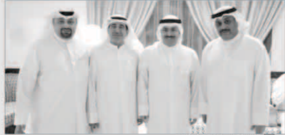
أعضاء مجلس إدارة العلاقات العامة

أكدت جمعية العلاقات العامة الكويتية أنها سوف تشارك في الاحتفالات بالأعياد الوطنية من خلال العديد من المسامعات، كما أنها أتمت الاستعدادات لمهرجان «الكويت لنا» الذي تنظمه الجمعية خلال شهر فبراير تزامناً مع مهرجان هلا فبراير. وقدمت جمعية العلاقات العامة في بيان لها التهنئة لسمو أمير البلاد الشيخ صباح الأحمد وسمو ولي العهد الشيخ نواف الأحمد وسمو رئيس الوزراء الشيخ جابر المبارك والشعب الكويتي بمناسبة الاحتفال بالأعياد الوطنية.