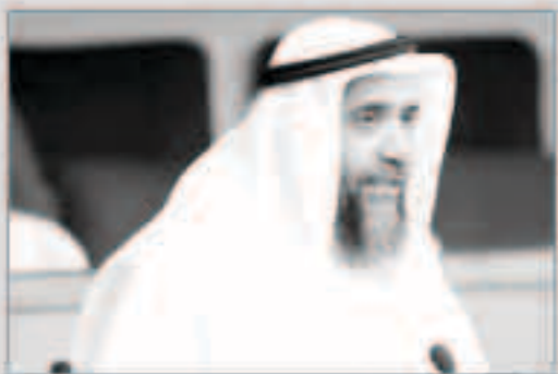
عبد الرحمن الجيران

صرح النائب الدكتور عبدالرحمن الجيران بأن لمرحلة القادمة تتطلب ضرورة المطالبة بتفعيل أدوات الرقابة والمتابعة على مؤسسة البترول وشركاتها التابعة أيضاً بملاحظات ديوان المحاسبة وبشكل متوازن يضمن الاستقلالية والعمل وتنفيذ المشاريع الكبرى وتحقيق الاستراتيجيات المرسومة وكذلك يضمن بسط رقابة الدولة ووصايتها عليها كونها شركات مملوكة للدولة بالكامل وخاصة أنها تشكل شريان الاقتصاد الكويتي.