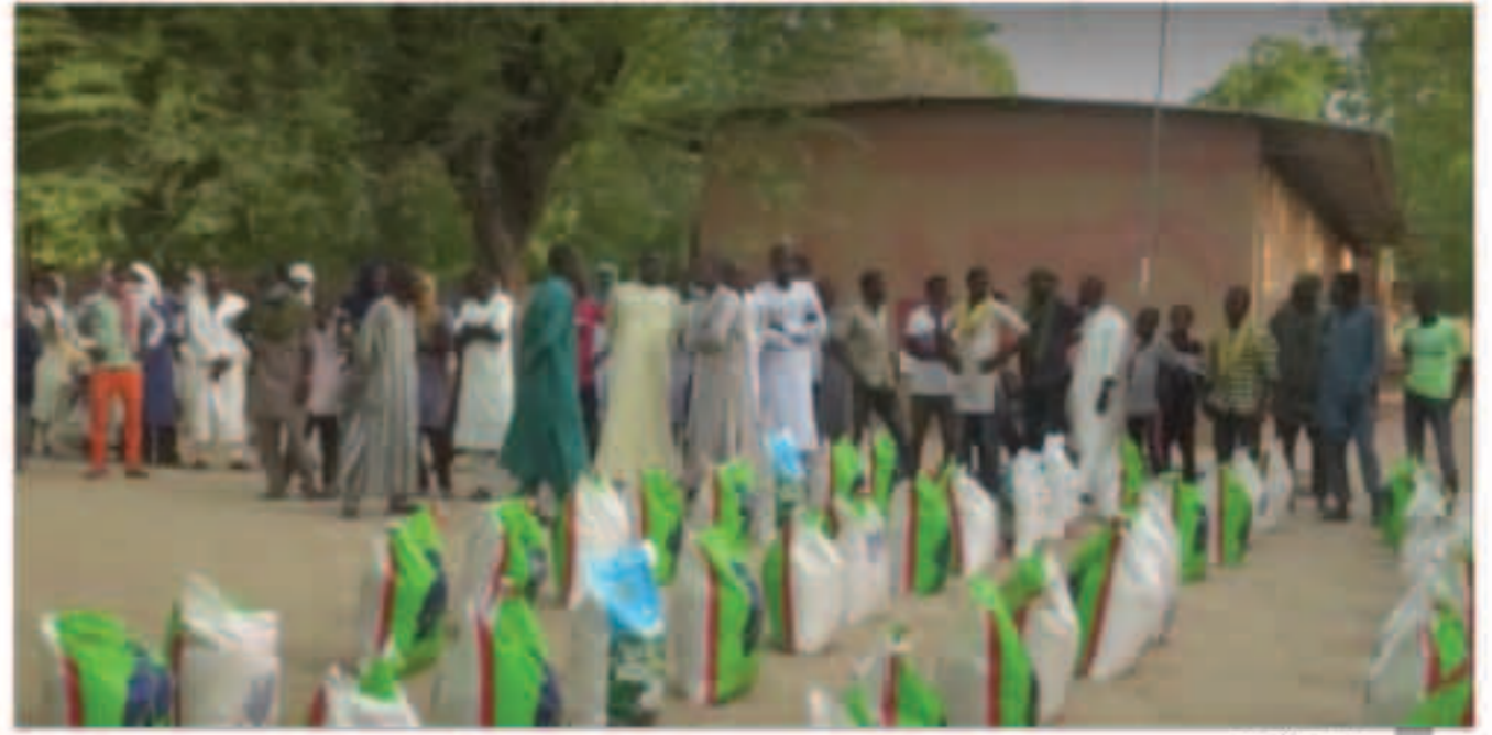
التوزيع في أريشيا

اما خارج الكويت فقد تم توزيع زكاة الفطر في العديد من الدول وخصوصاً في مخيمات اللاجئين في شرق أفريقيا وفي اليمن وفي البانيا وكوسوفا والنيجر ودول اخرى كثيرة.