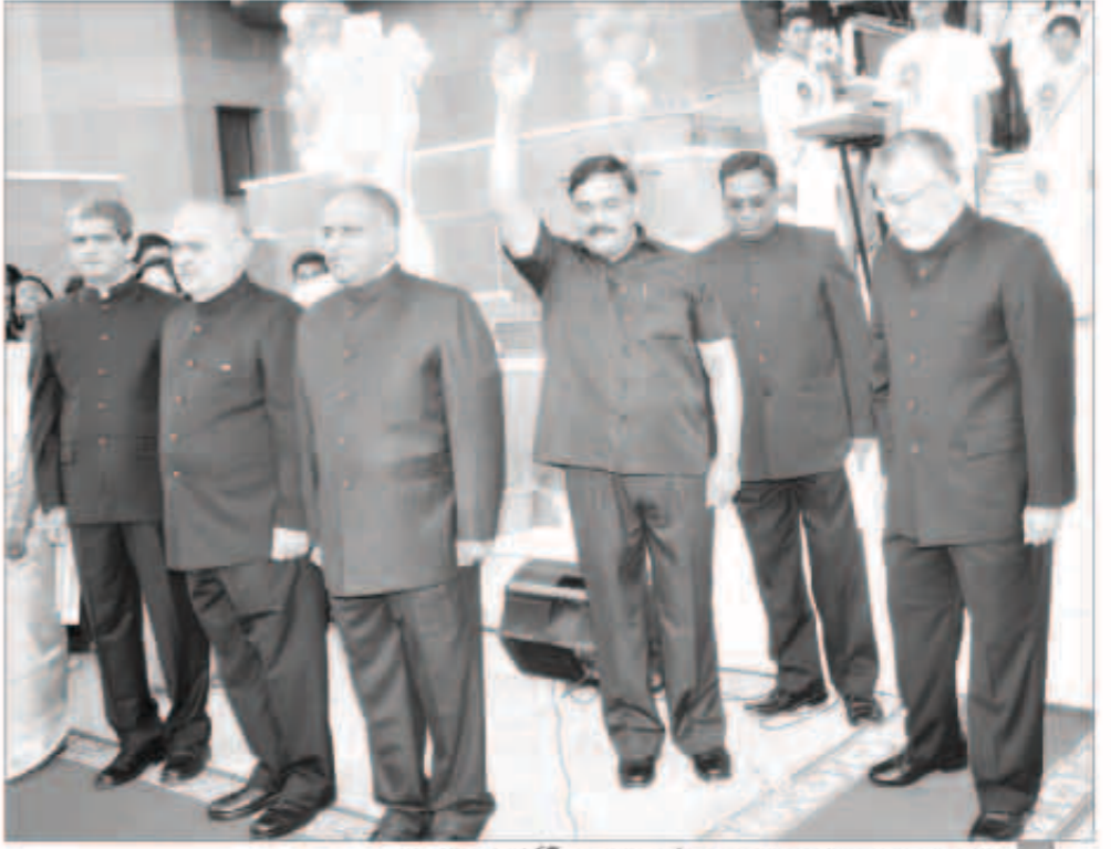
السفير الهندي خلال احتفال السفارة أمس بالعيد الـ 67 لاستقلال بلاده