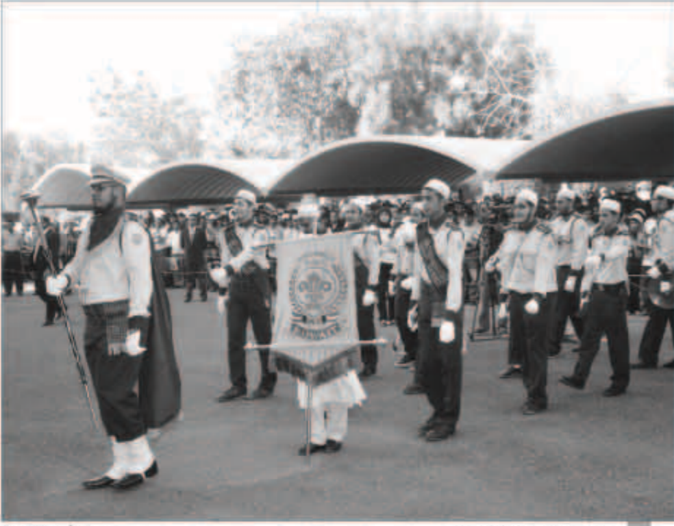
حركات استعراضية خلال الحفل