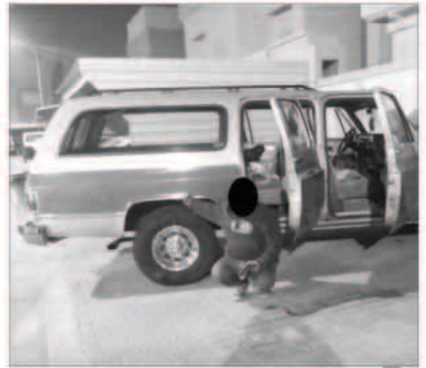
التهم التي تم القبض عليه

موايد يشبهه انها مخدرات وأدوات للتشبه بالجنس الأخر. وأبرزت إدارة الإعلام الأمني أن الواقعة برمتها تتعلق بغضبة عدم الامتثال لنقطة التفتيش بالتوقف بالإضافة إلى حيازة المخدرات والتشبه بالجنس الأخر ولا علاقة لها بأي تنظيم آخر.