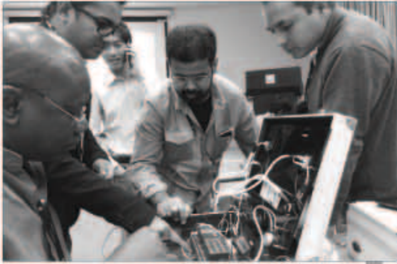
جانب من البرنامج الترويجي