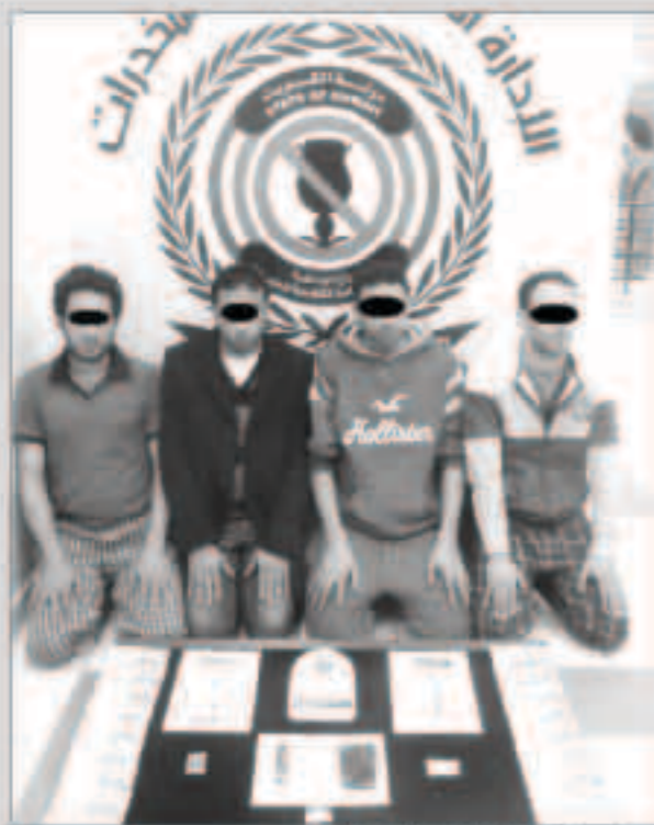
المعتقلون وأمامهم المصبوطات

في إطار الجهود المبذولة لتتبع ومضبط مهربي المخدرات ومروجيها تمكن رجال الإدارة العامة لمكافحة المخدرات (إدارة العمليات) من ضبط تشكيل عصابي مكون من أربعة أشخاص بحوزته 300 جرام حشيش و 50 غرام من مادة الماريغوانا. وكانت معلومات قد وردت إلى الإدارة العامة لمكافحة المخدرات تفيد بقيام واحد من جنسية عربية يقوم بالانتشار بالمخدرات المخدرة والمؤثرات العقلية وفور ورود هذه المعلومات قامت الإدارة العامة لمكافحة المخدرات بتشكيل فريق للتحريات اللازمة وبعد التأكد من صحة المعلومات واتخاذ الإجراء القانوني اللازم تم ضبط المتهم بمسكنه حيث كان يرفقه المتهم الثاني وهو من نفس الجنسية وينتقل بينهما عبر بحوزتهما على ما يقارب (250) جرام من مادة الحشيش المخدرة وعدد 50 جرام من مادة الماريغوانا وميزان حساس