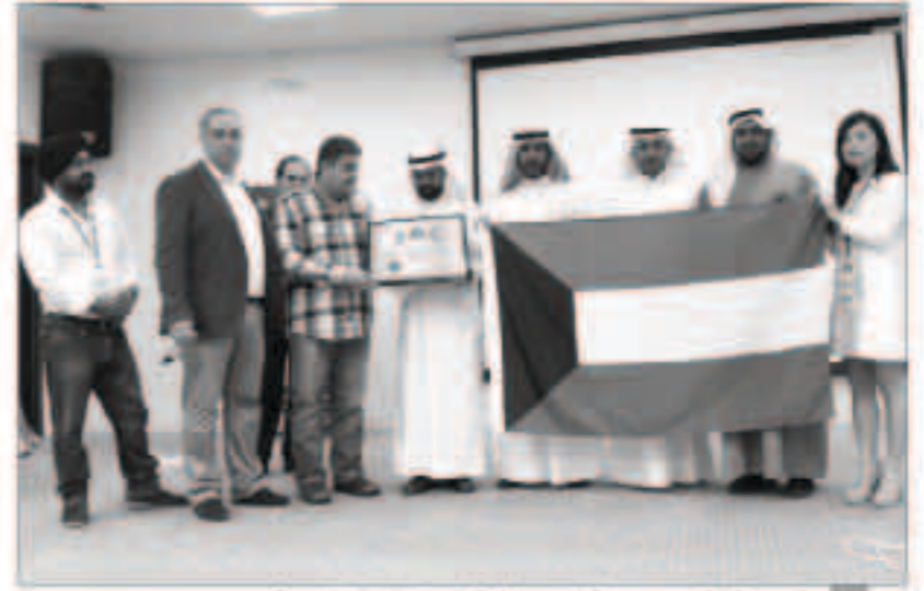
تكريم مبدئي مع مجموعة البيوت الذكية في ختام الدورة التدريبية

وقد تأسست في العام 1986 وولاية تكساس الأمريكية وتكون المجموعة من عدة مراكز متعددة متخصصة في المختبرات والتصنيع وإيضاً الحلول التقنية ولها أفرع في كل من الأردن والصين والدانمرك وهونغ كونغ وغيرها حيث تقوم بملكية الاحتياجات المتزايدة للمجتمعات حول العالم من الأنظمة الذكية.