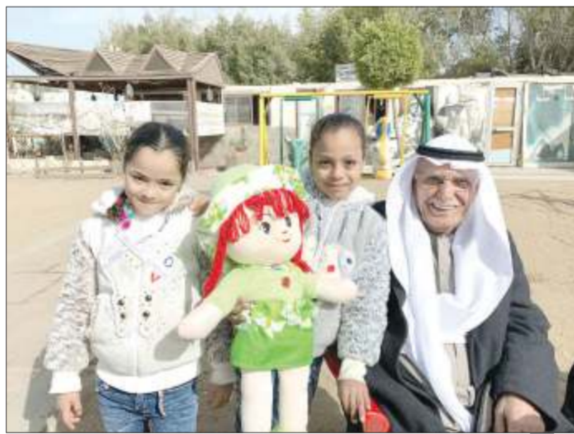
زيارة مستمرة للأيتام