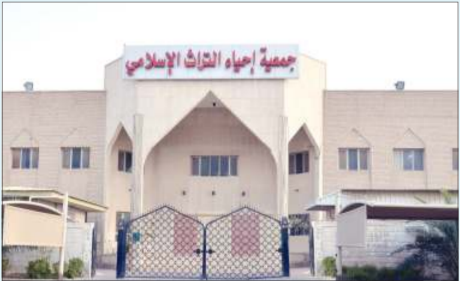
جمعية إحياء التراث