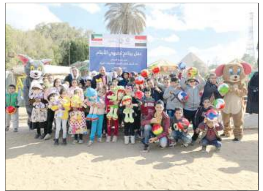
أنشطة ترفيهية قبل الجائحة

في هذه البلاد، ونحرص بدورنا في المتابعة عن كنف لأحوال الأيتام ومتابعة دراستهم وزيارتهم في مقر سكنهم، وسد احتياجات الأيتام وتحسين أحوالهم المعيشية والاجتماعية والتعليمية والصحية والنفسية، وأضاف إلى ما سبق تقديم الرعاية الثقافية والتربوية للأيتام في المجتمعات الإسلامية ووضع خطط التنفيذ، للتواصل ودعم مشروع كفالة الأيتام بالاتصال على 99401011-99401011-22667780.