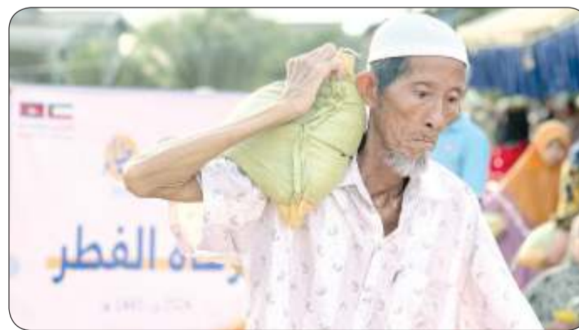
توزيع زكاة الفطر