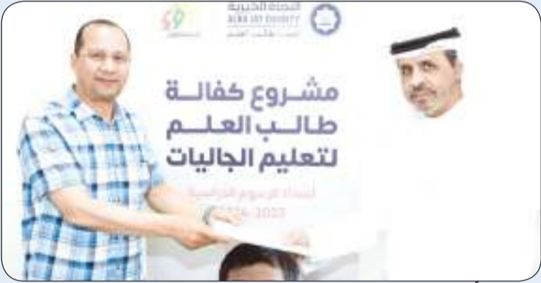
أمانة الأوقاف تدعم تعليم طلاب العلم ضيوف الكويت