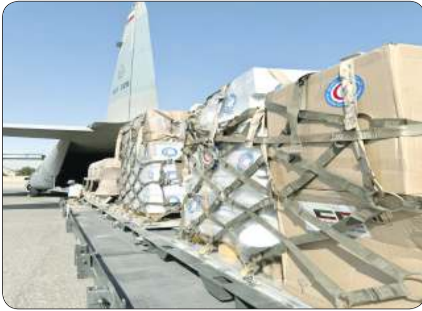
جانب من المساعدات المقدمة

يذكر أن أولى رحلات الجسر الجوي المخصص لإيغاث السودان انطلقت أمس الأول من قاعدة عبدالله المبارك الجوية متوجهة إلى مطار بورتسودان وعلى متنها 40 طناً من المواد الغذائية والطبية وسيارات الإسعاف وتمت تلك الرحلة ضمن حملة «فرقة السودان» الخاصة بالجمعية الكويتية للإيغاث بالاشتراك مع 8 جمعيات ومؤسسات خيرية كويتية.