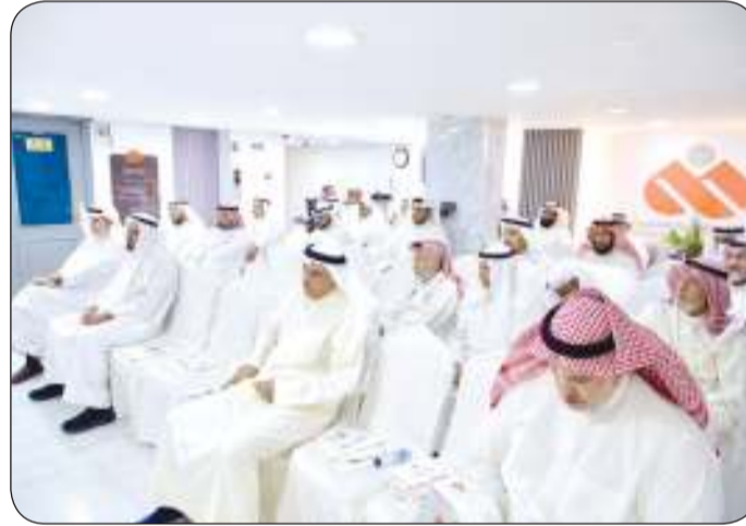
جانب من حضور الجمعية العمومية