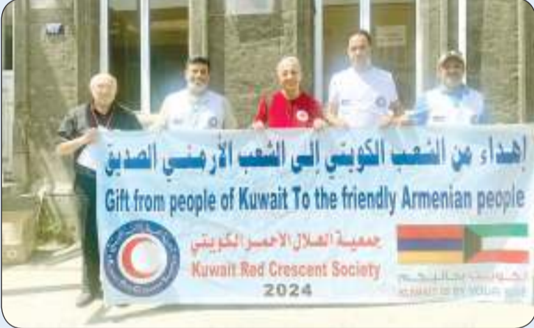
جانب من الحملة الإنسانية لمساعدة النازحين بأرمينيا

اشارة الى ان تنفيذ الحملة تم مع الصليب الاحمر الارمني لتوزيع المساعدات على النازحين والفقراء والمحتاجين في منطقة «شيراك» بعد نزوحهم من إقليم «ناغورنو كارباخ». وأوضح ان هذه المساهمات والمساعدات تعد امتداداً لجهود دولة الكويت الخيرية واسهاماتها في الميدان الانساني في كافة انحاء العالم ومشاركة منها لجهود المجتمع الدولي في تقديم المساعدات الإنسانية الهادفة للتخفيف من آثار التحديات الإنسانية التي تواجهها الفئات المستضعفة.