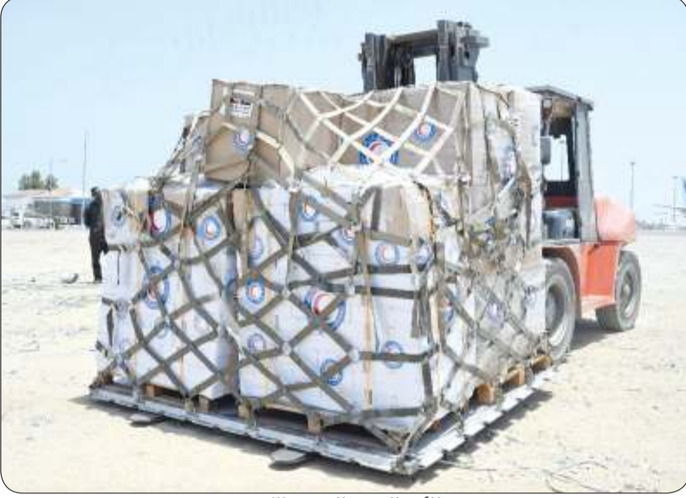
طائرة الجسر الجوي الكويتي

الطيري: مساعدات مباشرة ومستمرة أيضا عبر المنظمات والجمعيات الخيرية الكويتية العاملة هناك