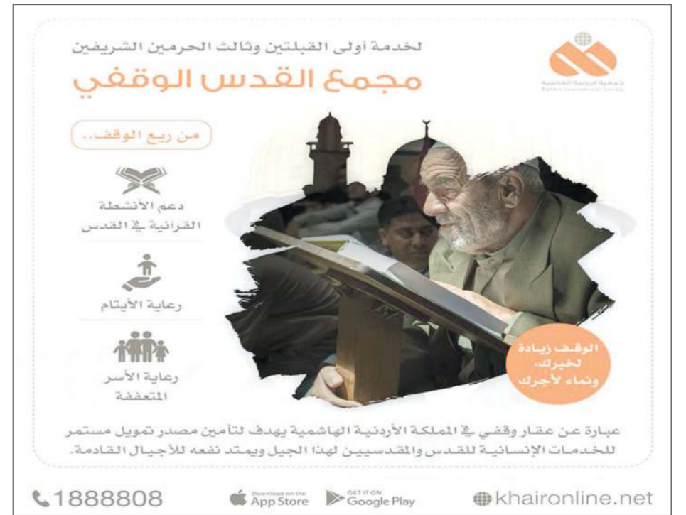
مجمع القدس الوقفي لخدمة أولى القبلتين وثالث الحرمين الشريفين

وتابع العنجري أن إطلاق هذا المشروع جاء استشعاراً من جمعية الرحمة العالمية بحجم التحديات الخطيرة التي يتعرض لها المسجد الأقصى المبارك التي يترقب حبه في قلب كل مسلم باعتباره أولى القبلتين وثالث المساجد التي تشد إليها الرحال. ونظراً لما تتعرض له مدينة القدس من محاولات متواصلة ومكررة لتقسيمها هويتها الإسلامية، وإجبار سكانها العرب على مغادرتها، من خلال هدم بيوتهم، نتيجة الغرامات المالية التي