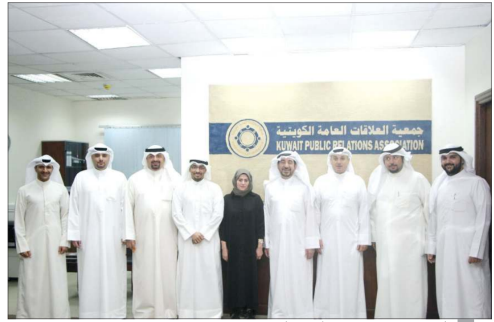
أعضاء جمعية العلاقات العامة هناؤا سمو الأمير بالتكريم