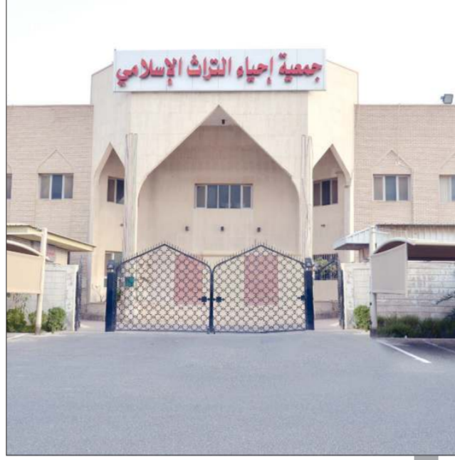
جمعية إحياء التراث