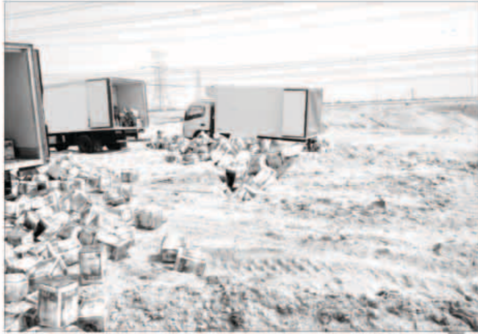
البلدية تتخلص من أطنان الأجبان الفاسدة

من جانبها دعت إدارة العلاقات العامة بالبلدية المواطنين والمقيمين إلى الإتصال على خط البلدية الساخن 139 وذلك في حال وجود أي شكوى تقع ضمن اختصاصات بلدية الكويت سواء في مجالات الأغذية، النظافة العامة، الباعة المتجولين، مشيرة إلى انه سيتم التعامل معها وفقاً للوائح وانظمة البلدية وذلك باتقصى سرعة ممكنة.