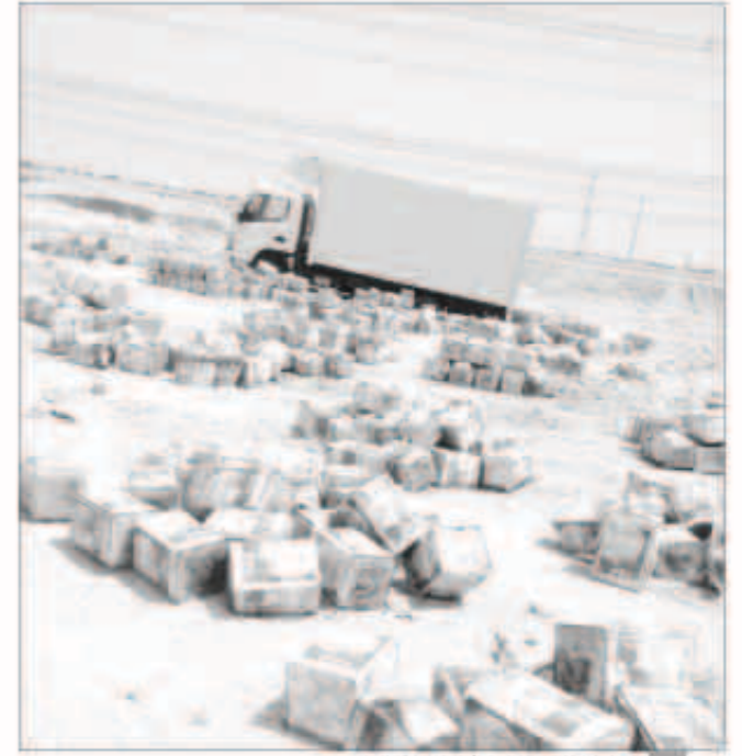
كميات كبيرة من الأجبان المصادرة