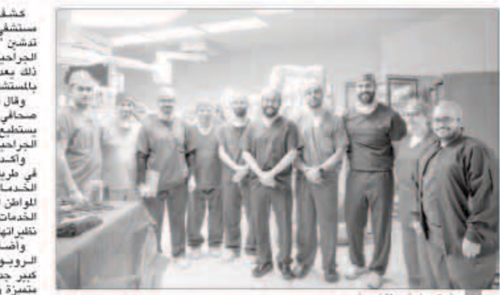
فريق جراحة مستشفى جابر

كشفت رئيسة قسم الجراحة في مستشفى جابر د. سلمان الصباح عن تدشين «الروبوت» في إجراء العمليات الجراحية في مستشفى جابر، مؤكداً أن ذلك يعد خطوة نوعية لقسم الجراحة بالمستشفى. وقال د. سلمان الصباح في تصريح صحافي أمس إن الروبوت الجراحي يستطيع إجراء جميع العمليات الجراحية بنجاح كبير ودقة عالية. وأكد أن مستشفى جابر يمضي في طريقه نحو التميز والريادة في الخدمات الصحية، من أجل خدمة المواطن الكويتي، وضمان تقديم أفضل الخدمات الطبية بأعلى جودة تضارع نظيراتها في دول العالم المتقدم. وأضاف أن التقنيات الحديثة مثل الروبوت الجراحي تسهل إلى حد كبير جدا عمل الأطباء وتحقق نتائج متميزة وتعمل بسهولة أكثر، موضحة