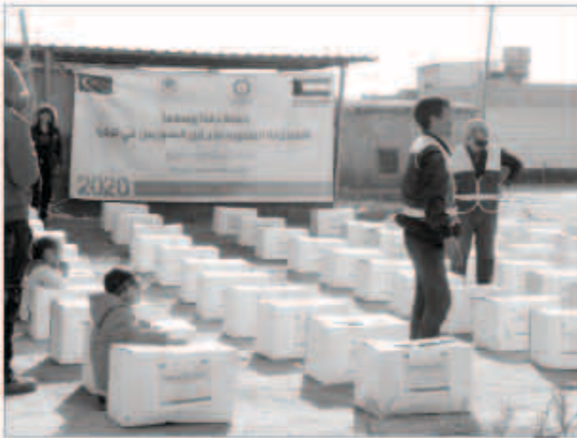
جانب من المساعدات