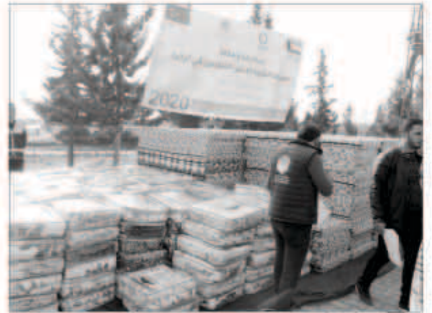
«دفعنا وسلاماً» لايتوقف عملنا