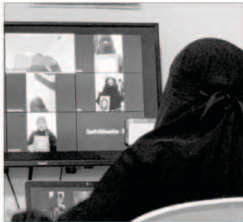
تفاعل كبير حولتبه أنشطة اللجنة من بعد

جنباً إلى جنب مع كافة ووحدات الدولة والهيئات والمؤسسات الوطنية من أجل نشر الوعي وإنصال رسالتنا للجاليات الوافدة. للتواصل مع لجنة التعريف بالإسلام زيارة مواقع اللجنة عبر شتى منصات اللجنة أو الاتصال بالخط الساخن الخاص بالقسم النسائي 65533314.