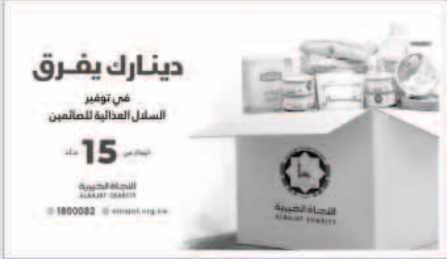
قيمة السلة الغذائية طوال اشهر 15 ديناراً

الكويت في العام الماضي - وختاماً تقدم الكندري بشكر أهل الخير داعياً زكاة العثمان، مؤكداً أنهم شركاء النجاح ووصفهم بأصحاب الأيدي النظيفة يعطر الصدقات، لافتاً أن العمل الخيري الكويتي عدا ابغونه ورمزاً يقفى المرء في خدمة الإنسانية والإنسانية فقط. ويمكن التواصل مع اللجنة لدعم مشاريعها يمكن لأهل الخير التواصل على الأرقام 9938878 - 22667780 99401011-