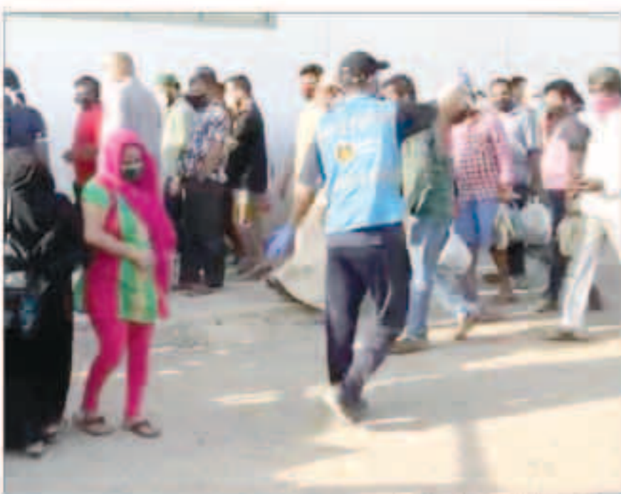
موقع لتوزيع مقابل جمعية الجليب

لم تتوقف الفرق التطوعية التي نعمل من خلالها والتابعة لمركز الهداية في جمعية إحياء التراث الإسلامي عن العمل في تقديم المساعدات لمن يحتاجها وخصوصاً توزيع الخبز مجاناً على أماكن تجمعات العمالة المنقطعة عن العمل