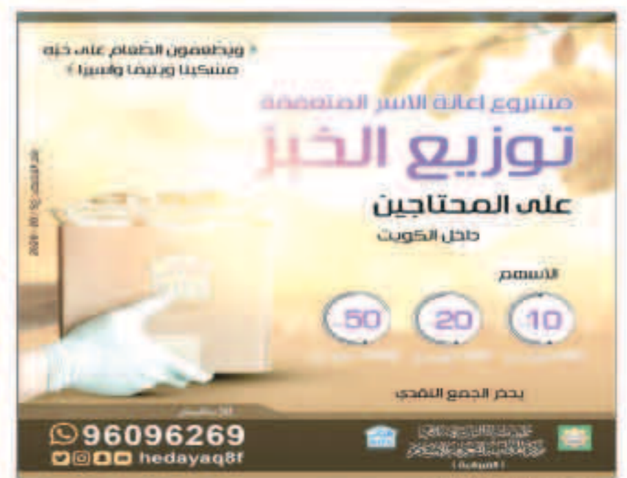
توزيع الخبز مركز الهداية