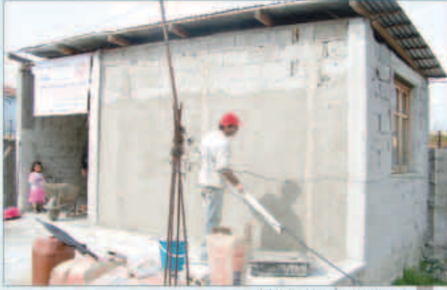
ترميم البيوت أحد أهم مشاريعنا بألبانيا

نمتلك مشاريع تنموية رائدة مختلفة بدول البلقان «زكاة سلوى»: نسعى لترميم وبناء 50 منزلاً للفقراء والأيتام في ألبانيا