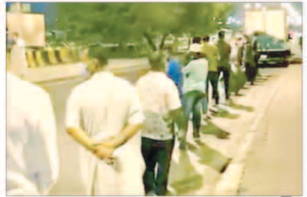
طوابير توزيع الخبز

صلى الله عليه وسلم - ( والله لا يؤمن من بات شعبان وجاره جاع ) لذا فإن علينا جميعاً أن نتعاون في سد حاجة أخواننا من الخبز والمواد الغذائية وأن نتكاتف حتى تتجلى هذه الغمة وتعود الأمور إلى طبيعتها إن شاء الله .