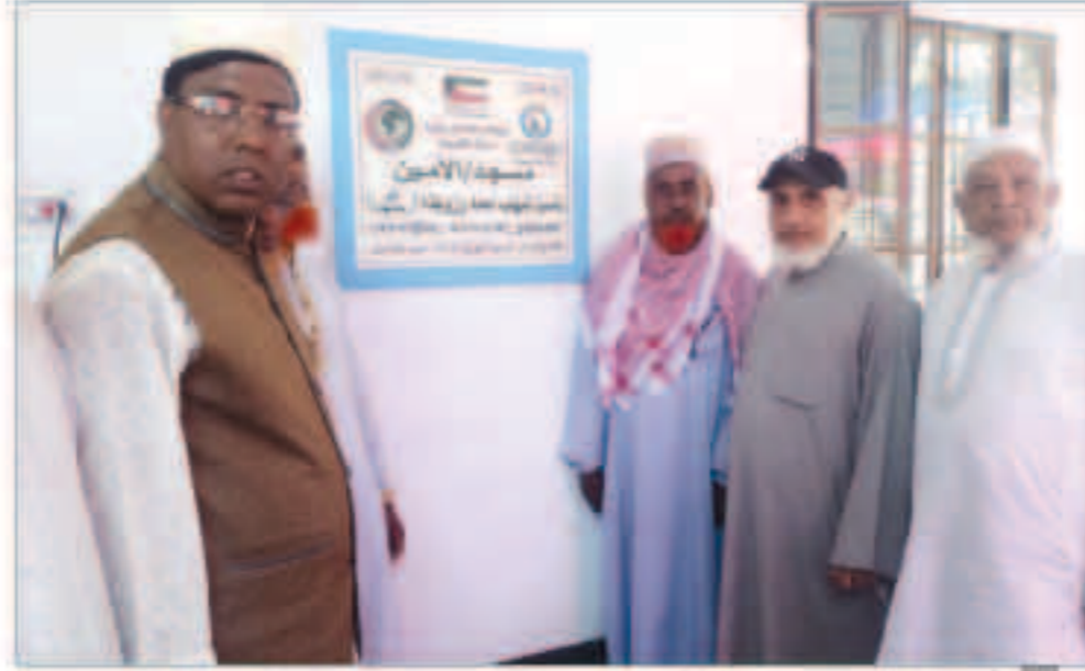
أحد المساجد التي شيدها زكاة الرميثية

ويمن السحيب؛ أن زكاة سلوى حرصت أن يكون لها بصمة كبيرة تجاه دعم وإنشاء المشاريع الخيرية ذات النفع التنموي والحضاري والتي يسطرها المشاريع في أذهان الشعوب والدول الأخرى، حيث