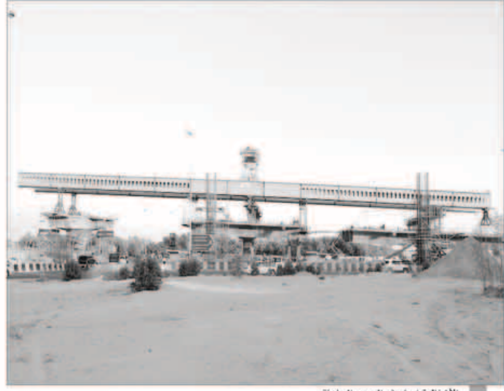
الأشغال تواصل رفع الجسور الجاهزة

■ بود ستور: عمليات تركيب قطع الجسور تتقدم بالرافعة المعلقة العلوية فوق دوار الأمم المتحدة