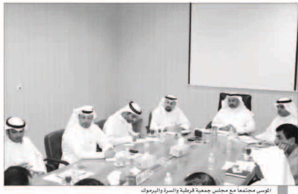
الموسى مجتمعاً مع مجلس جمعية قرطبة والسرة واليرموك