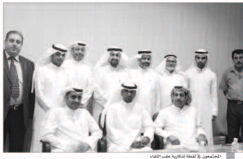
المتجمعون في لقطة تذكارية عقب اللقاء

وتوزع 20 ألف منشورة توعوية والاجتماع مع خطباء المساجد ولتنبيه الناس بهذا الخصوص وكما حددت الجمعيات التعاونية مواقع مخصصة لوضع المواد القابلة لإعادة تدوير من مخلفات المنازل وتشجيع المواطنين على فرز مخلفات المنازل من