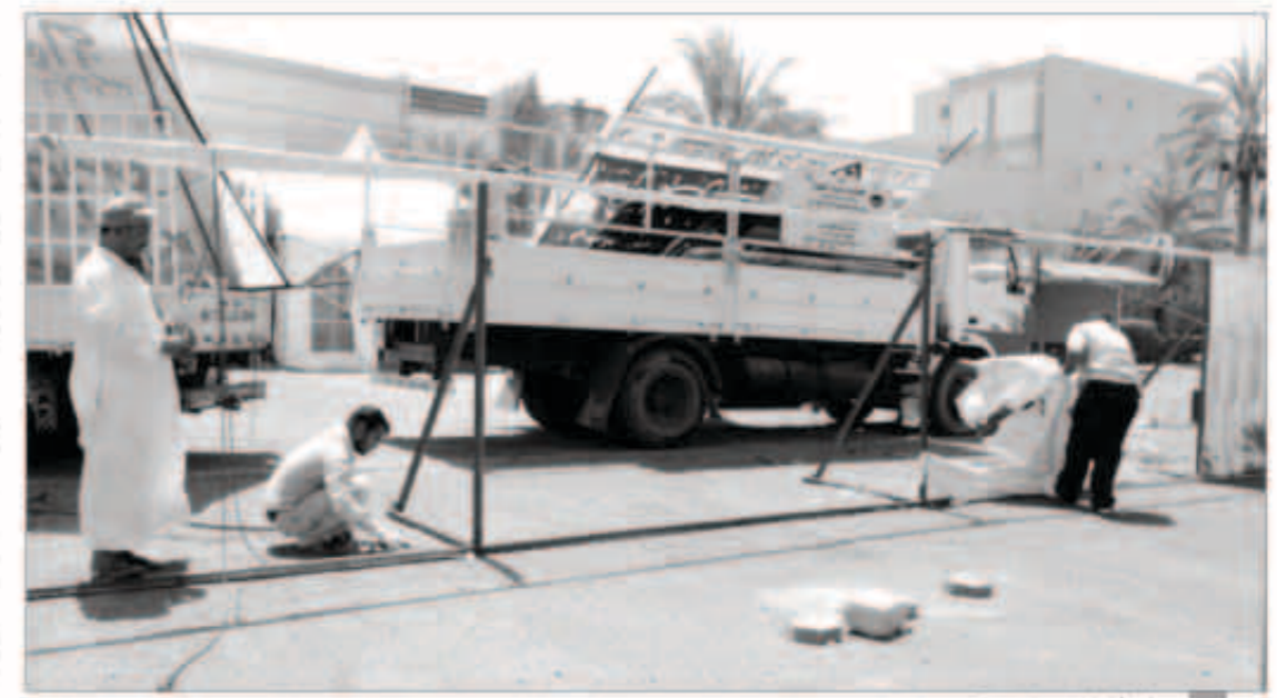
رفع الإعلانات المخالفة

واختتم تصريحه داعياً المواطنين والمقيمين في عدم التردد بالاتصال على خط البلدية الساخن «139» في حال وجود أي شكوى تتعلق بجهاز البلدية سواء كانت في مجالات الأغذية ، النظافة العامة ، الباعة المتجولين ، أو أي مجالات أخرى ، مشيراً إلى أنه سيتم التعامل معها طبقاً للوائح وأنظمة البلدية وذلك تنفيذاً لتعليمات القيادة العليا بالبلدية .