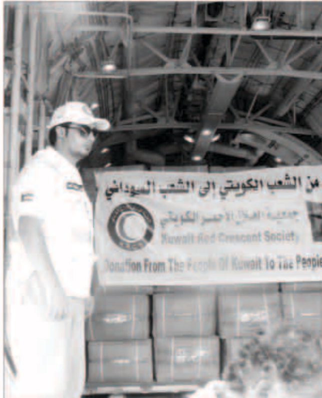
فريق الهلال الأحمر يباشر توزيع المساعدات