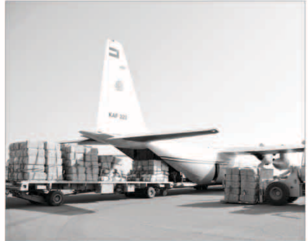
الجسر الجوي يواصل نقل المساعدات إلى السودان

تصريح مماثل لـ «كويتنا» عن تقدير الشعب السوداني للوقفة الكويتية المشرفة مع منكوبي السيول والأمطار التي ضربت أنحاء واسعة من البلاد بشكل غير مسبق في المدى القريب.