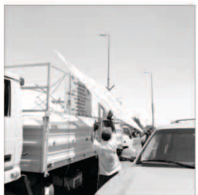
البلدية تواصل إزالة الإعلانات