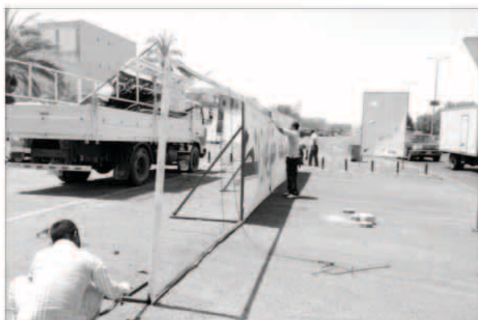
الجهاز دعا المواطنين والمقيمين للإبلاغ عن المخالفات