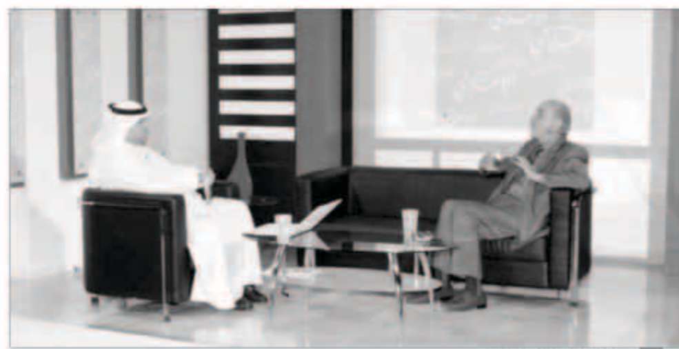
... وخلال استضافة السنوسي