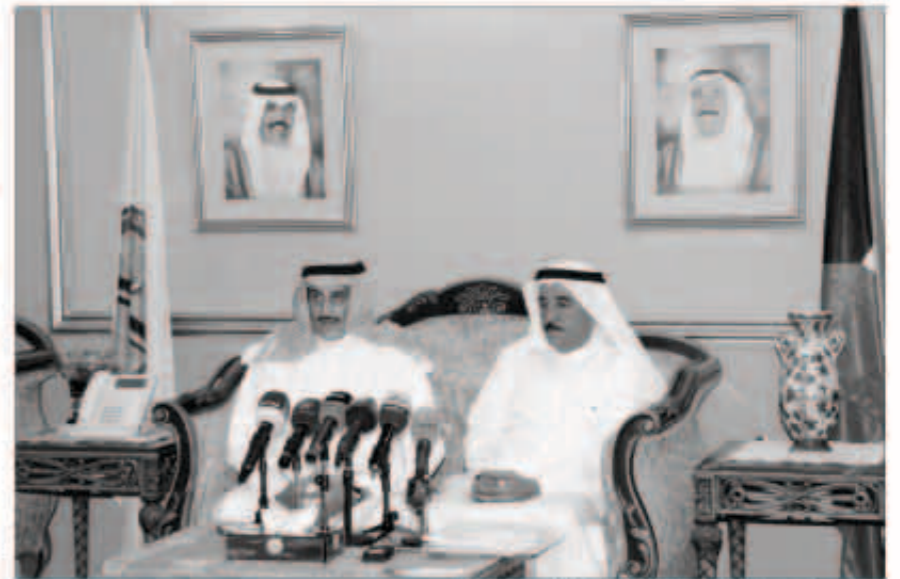
محافظ الأحمدية يتحدث في المؤتمر الصباحي

المركز الثقافي بالأحمدية سيضم متحفاً يحتوي مختلف الوثائق المتعلقة بنشأة المدينة ■ ندعو إلى الحفاظ على الطابع التاريخي للسوق القديم وتفاعلنا مع نبض مواطني المنطقة