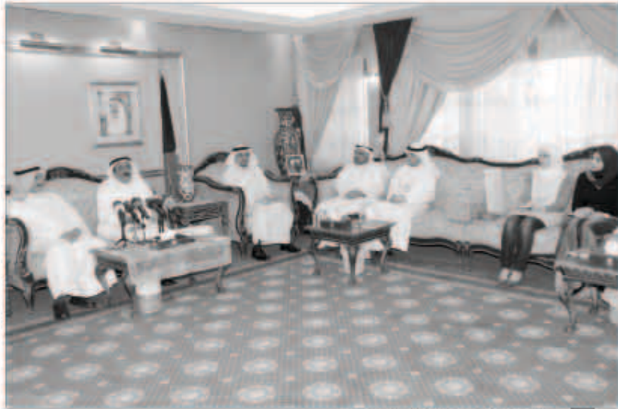
جانب من الاجتماعات الخاصة بالمبادرة