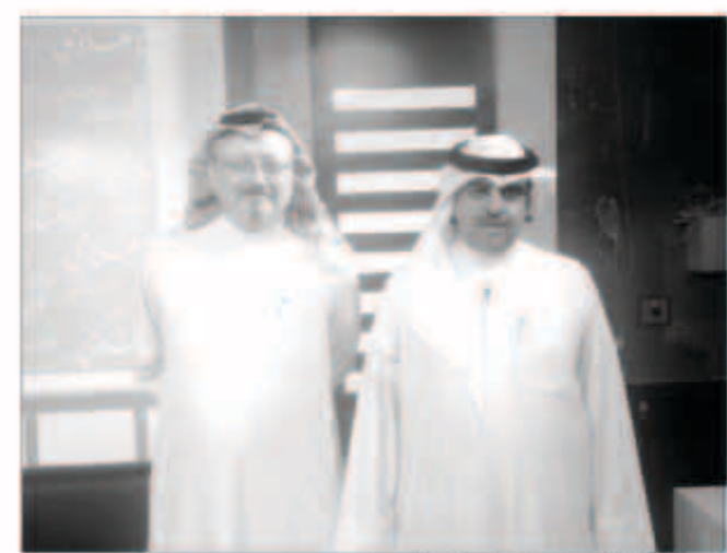
الخميس في برنامج «الإعلامي»

■ البرنامج يسلط الضوء على كل القضايا ويفتح آفاقاً للحوار والنقاش حولها