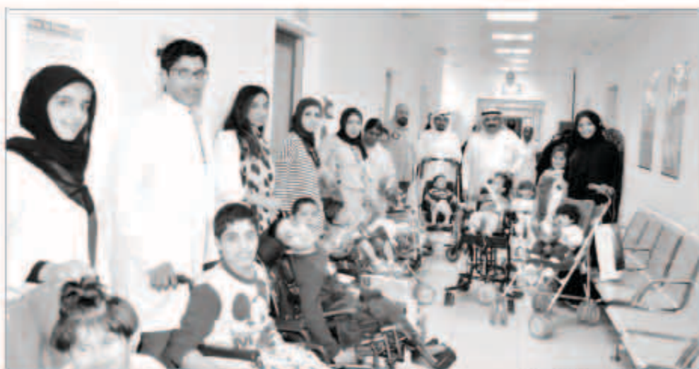
المهندسون والمهندسات مع مجموعة من الأطفال

■ نسعى إلى مشاركة المجتمع كله بجميع المناسبات ونشيد بتعاون العاملين في المستشفى