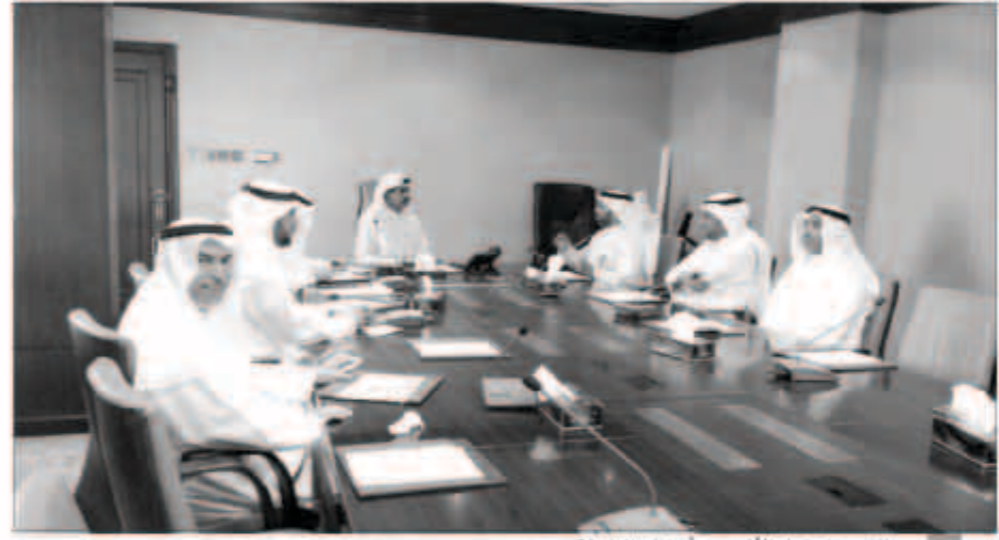
جانب من اجتماع الأثري مع أعضاء الرابطة

وأوضح أن الرابطة طرحت على المدير العام جملة قضايا أكاديمية منها ضرورة رصد ميزانية كافية لتغطية مستحقات الأساتذة وإيجاد آلية صرف جديدة تضمن عدم تأخر المستحقات وصرافها في مواعيد محددة، والبت في حقوق ومكتسبات مبعثي التطبيقي وسماواتهم بخلافهم من جامعة الكويت، وحسم قضية الفراغ