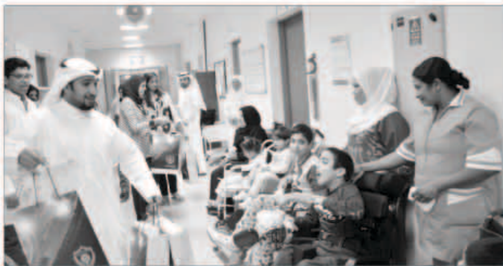
توزيع الهدايا على الأطفال خلال الزيارة