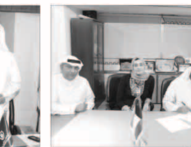
جانب من احتفالية توقيع الاتفاقية