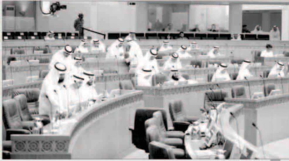
جانب من الجلسة امين

■ التميمي: المجلس الماضي تربص به فلول المعارضة السابقة ومعصومة مشهود لها بالوطنية