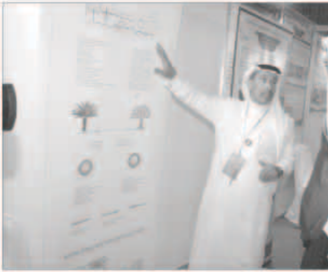
وزير الإعلام يستمع إلى الشرح

وأشار إلى ان المخترعين الكويتيين يحصلون على دعم من مؤسسة الكويت