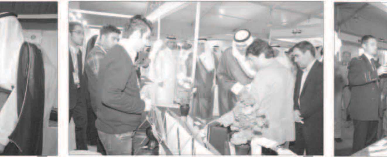
دول متعددة شاركت بمعرض الكويت