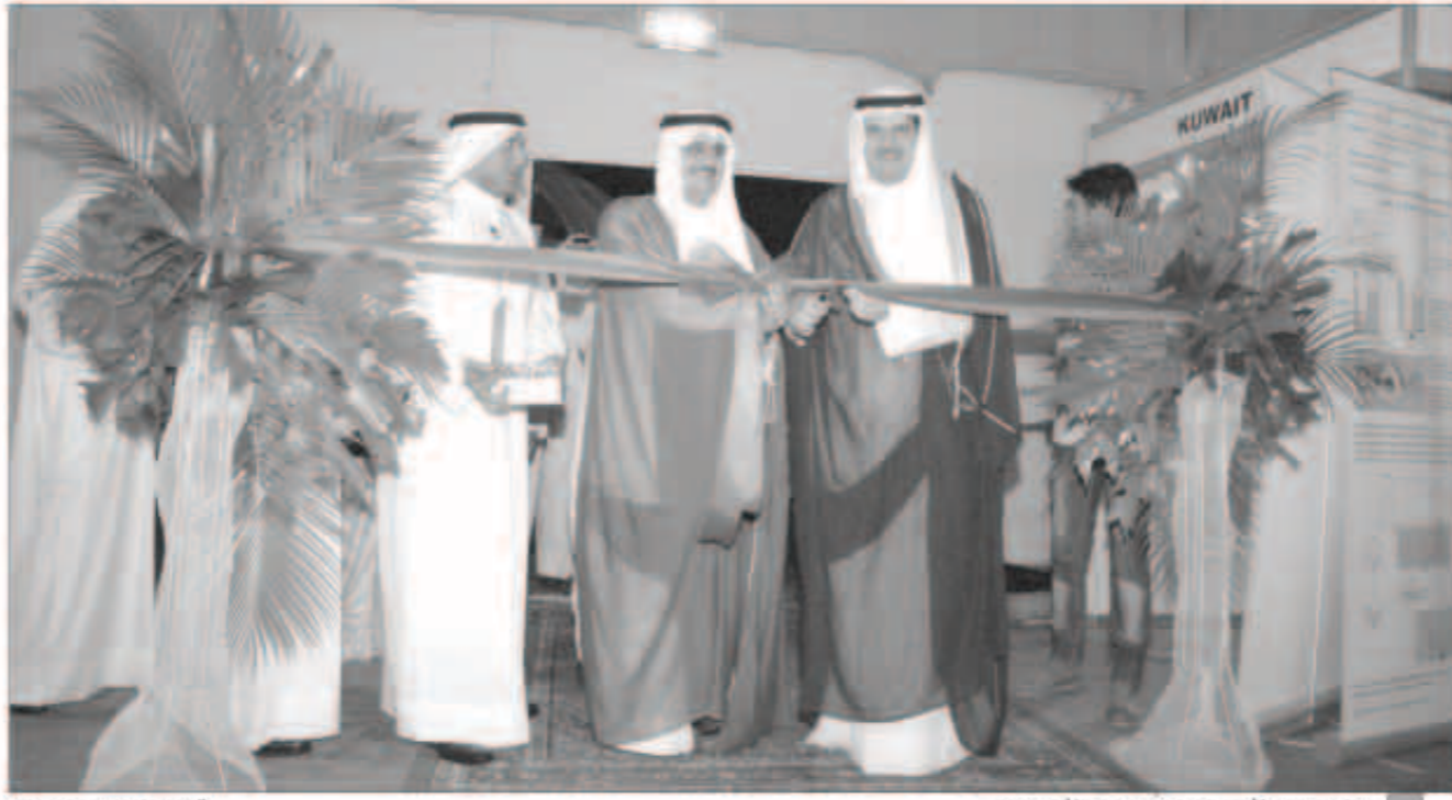
ممثل سمو الأمير مفتتحاً معرض الاختراعات