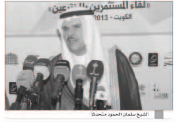
الشيخ سلمان الحمود متحدثاً

وسائل الإعلام مدعوة للتركيز على الفعاليات ليستفيد منها الجمهور والزوار