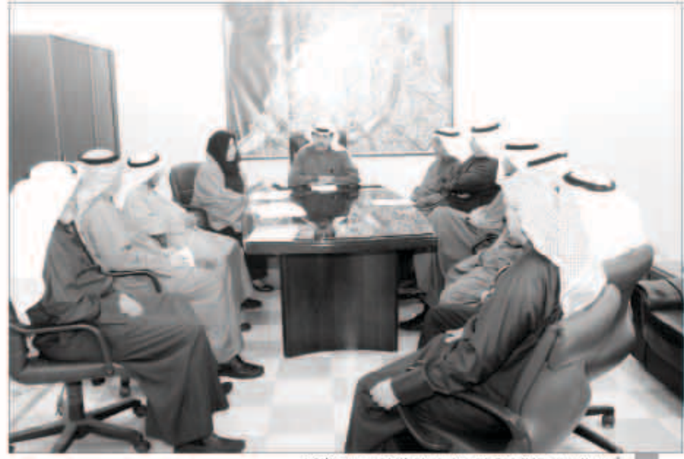
أحمد الصبيح خلال اجتماعه برؤساء القطاعات ومديرى الأفرع

اجتمع مدير عام البلدية المهندس أحمد الصبيح مع رؤساء القطاعات وممرأة الأفرع وبحضور مدير إدارة العلاقات العامة. وجاء ذلك بناء على تعليمات وزير الدولة لشؤون البلدية ووزير المواصلات حث خلاله القيادات والمسؤولين باتخاذ الإجراءات اللازمة تجاه مخالفات البناء الموجودة وأهمية الوقوف على هذه المخالفات من خلال معاينتها