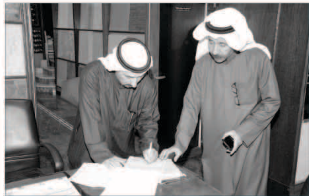
مفتشو البلدية خلال تحرير المخالفات